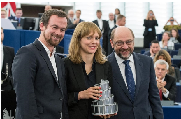
La regista Maren Ade riceve il Premio LUX per "Toni Erdmann". Strasburgo, novembre 2016