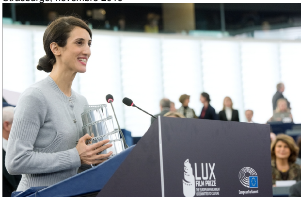
La regista di Mustang, Deniz Gamze Ergüven , si rivolge alla Plenaria dopo la proclamazione del Premio LUX 2015. Strasburgo, novembre 2015