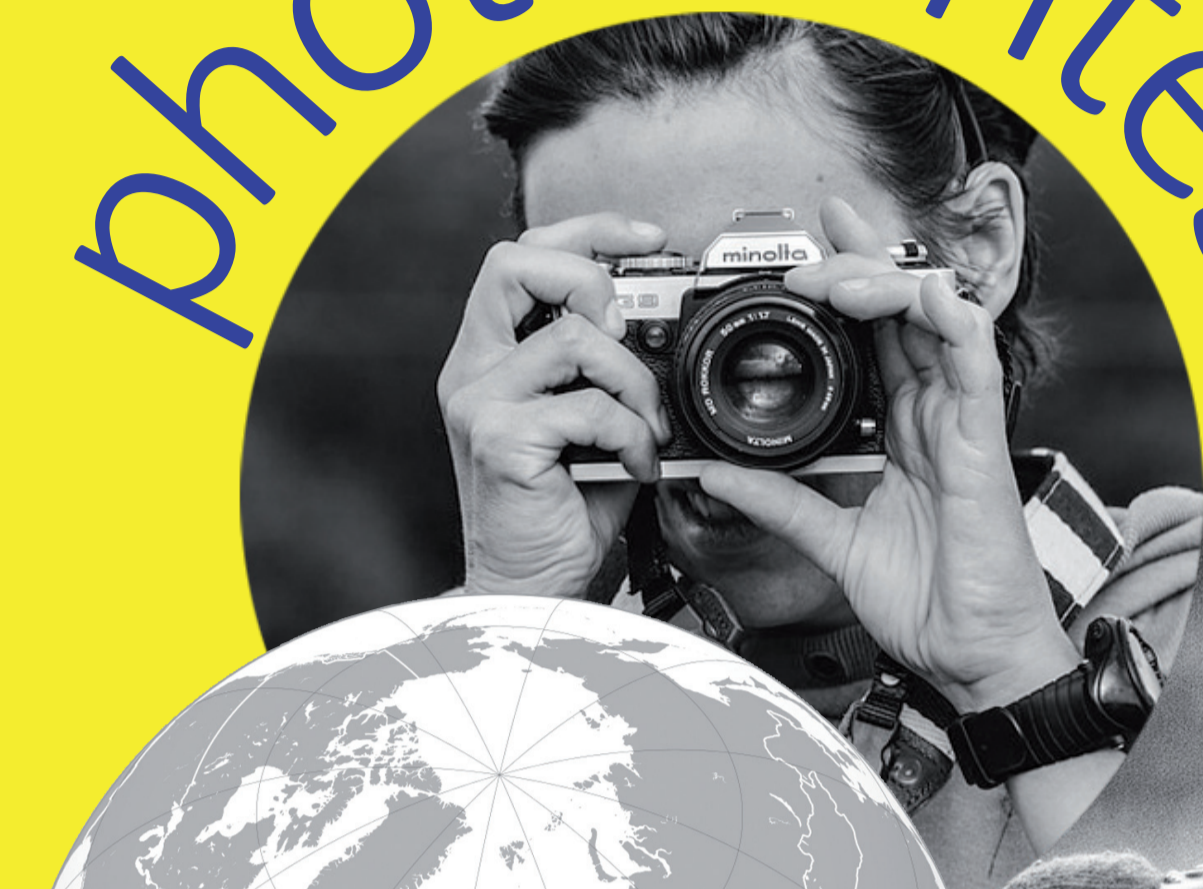
photo C ontest