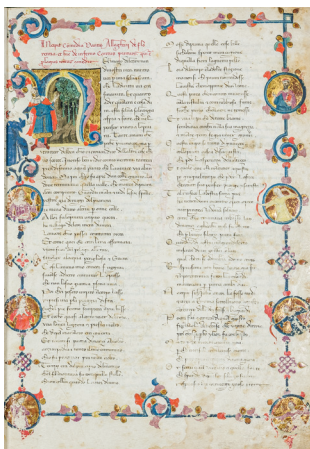
Parma, Biblioteca Palatina, ms. Parm. 3285. Dante, Commedia .