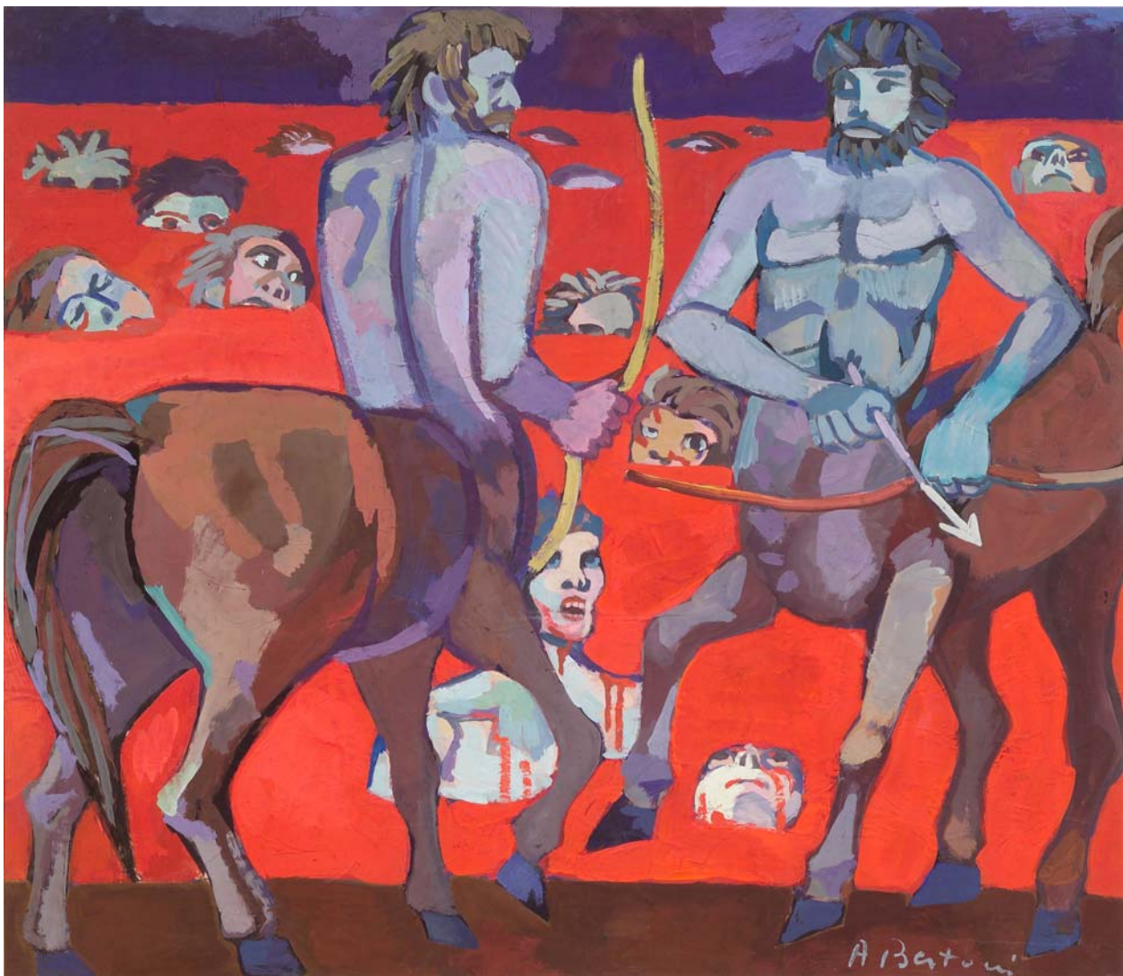
Anna Bertoni, I Centauri (tempera su carta, centimetri 133 per 119)