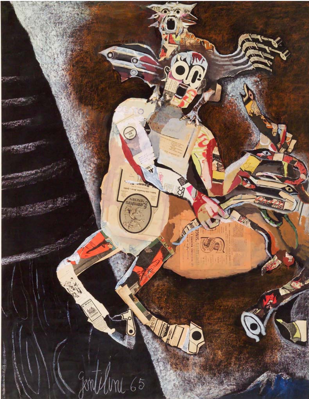
Franco Gentilini, Caco il Centauro (tecnica mista con collage su carta, centimetri 119 per 148)