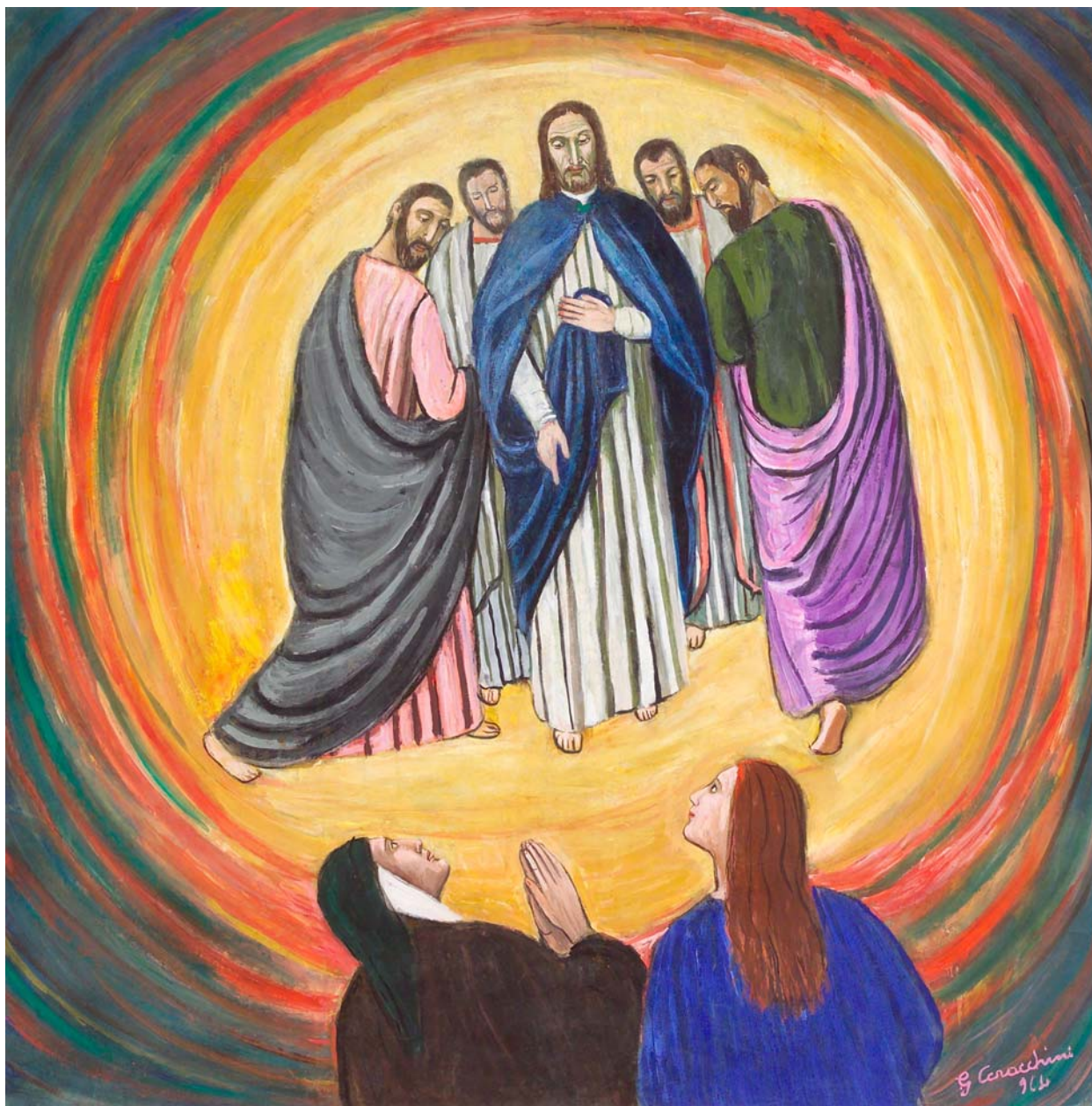
Gisberto Ceracchini, Esame di Dante sulla Carità (tempera su carta, centimetri 150 per 159)