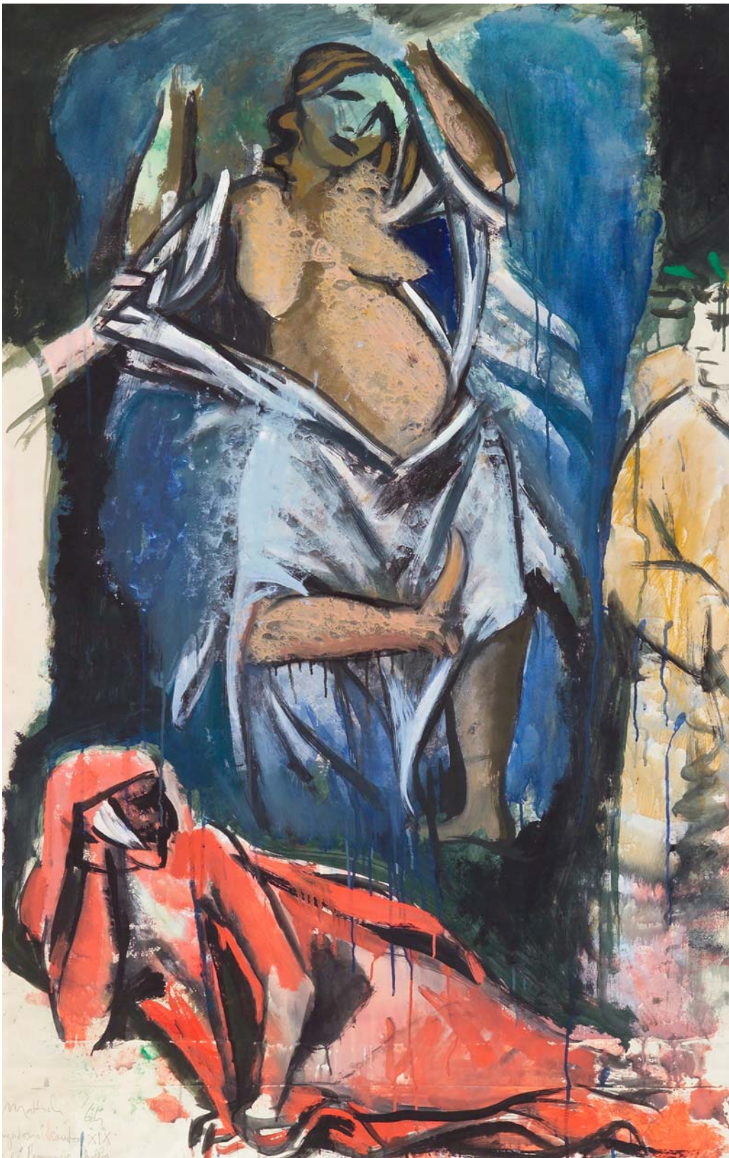
Carlo Mattioli, La femmina balba (tempera su carta, centimetri 99 per 148)