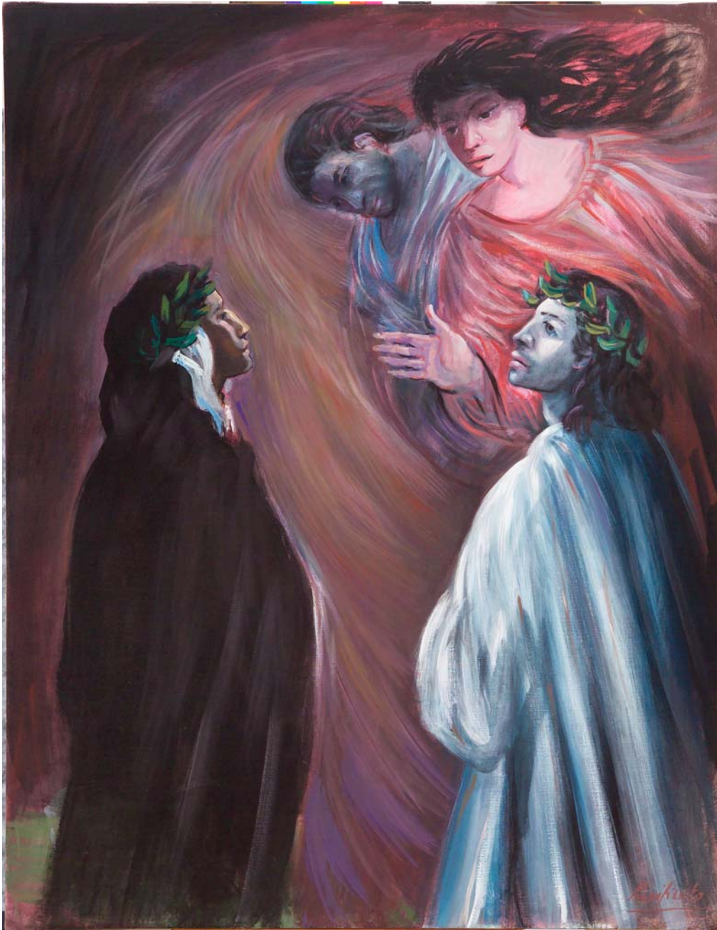
Domenico Purificato, Paolo e Francesca (acrilico su tela, centimetri 99,5 per 130,5)