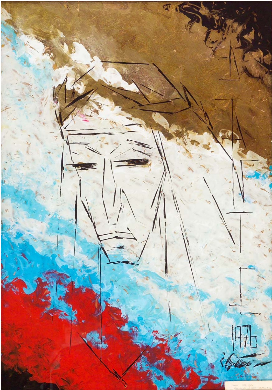
Eugen Ciuca, Ritratto di Dante , olio e foglia d'oro su vetro (centimetri 62 per 89)