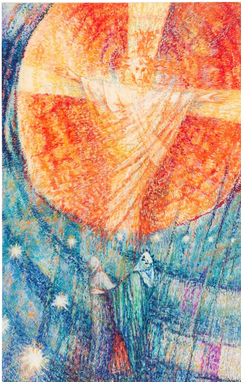
Lino Bianchi Bariviera, La croce degli spiriti beati (tecnica mista su carta, centimetri 100 per 150)

Queste immagini riproducono un nucleo di 21 cartoni per mosaici a tema dantesco e un ritratto del Poeta a foglia d'oro su vetro, opere pressoché inedite, restaurate e conservate dal Museo d'arte della città di Ravenna. I cartoni preparatori furono realizzati in occasione del VII centenario della nascita di Dante, celebrato a Ravenna nel 1965, e di un concorso su tema dantesco di poco precedente.