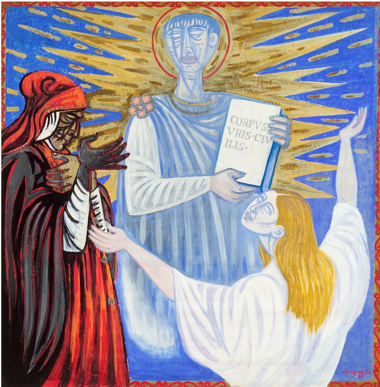
Giuseppe Migneco, Giustiniano (tempera su carta, centimetri 148,5 per 150)