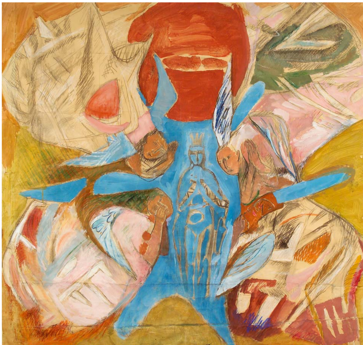
Bruno Saetti, La visione di Dio (tecnica mista su carta, centimetri 210 per 203)