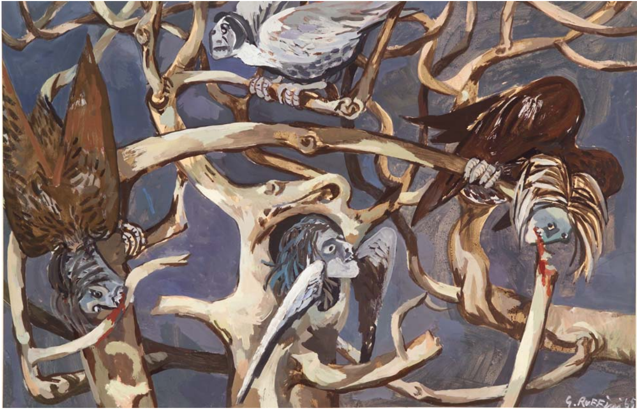
Giulio Ruffini, Le Arpie (tempera su carta fissata su masonite, centimetri 153 per 104)