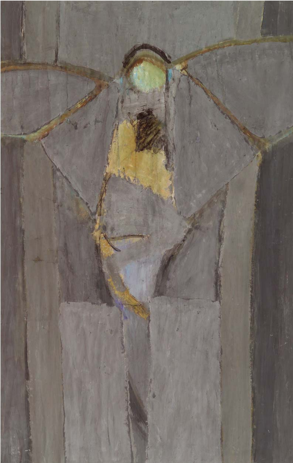
Primo Costa, Gerione (olio su cartoncino, centimetri 99 per 150)