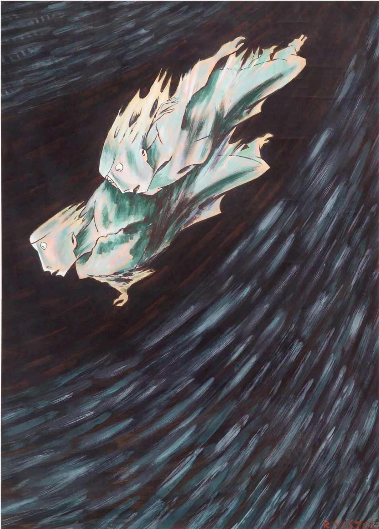
Raul Vistoli, Paolo e Francesca (tempera su carta, centimetri 106 per 142)