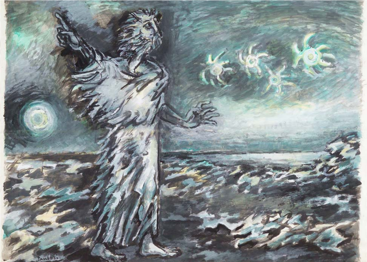
Orfeo Tamburi, Catone (tempera su carta, centimetri 138 per 100)