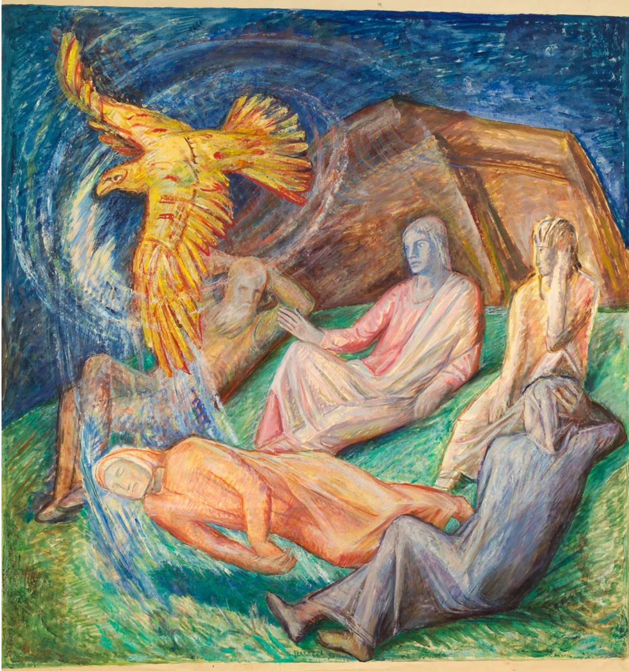
Ferruccio Ferrazzi, L'aquila d'oro (olio su carta, centimetri 150 per 167)