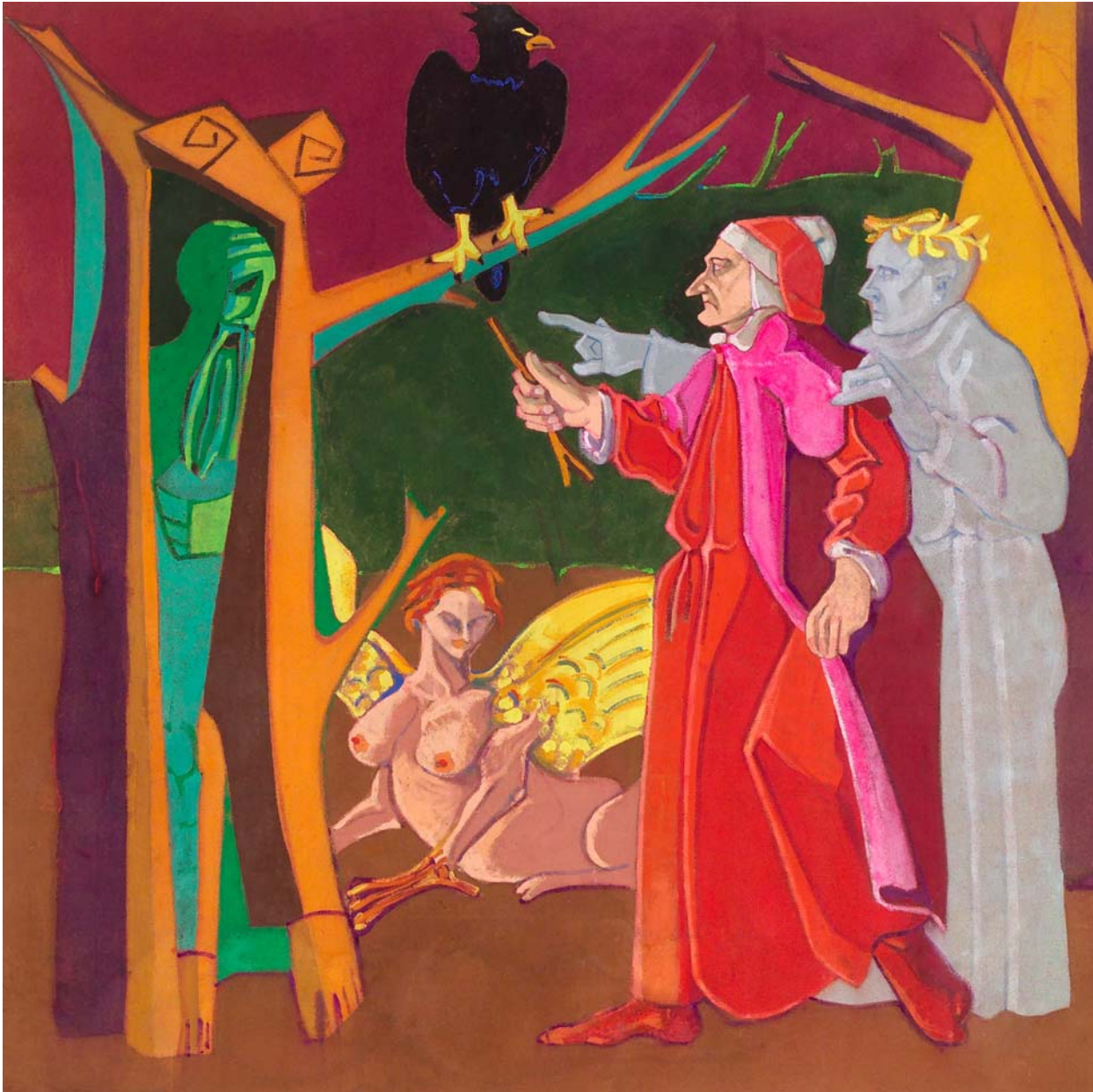
Anonimo, senza titolo (acrilico su masonite, centimetri 149 per 149)