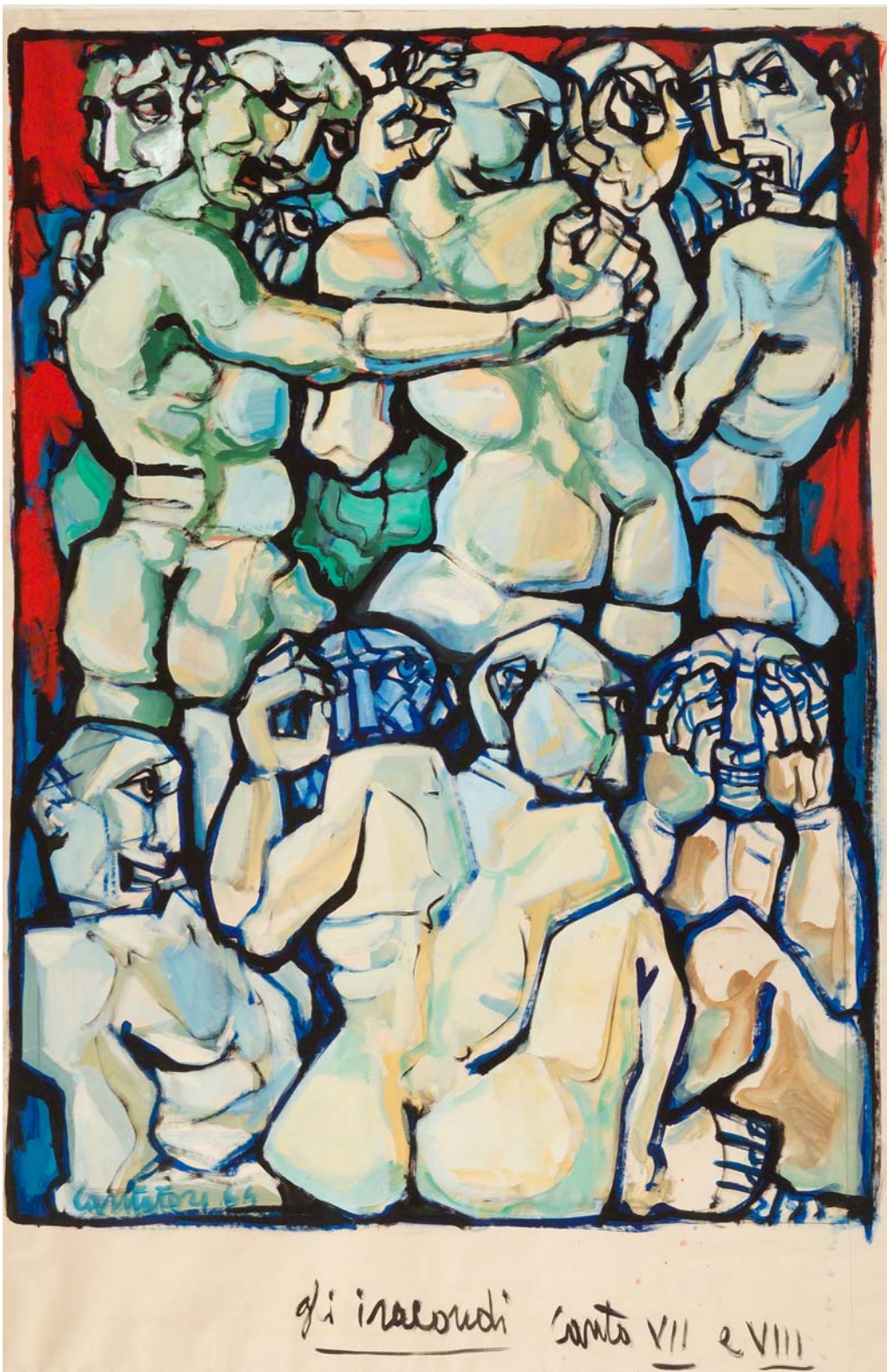
Domenico Cantatore, Gli iracondi (tempera su carta, centimetri 116 per 176)