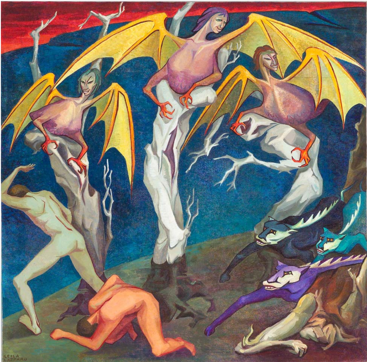
Leila Lazzaro, I violenti (acrilico su tela, centimetri 130 per 128)