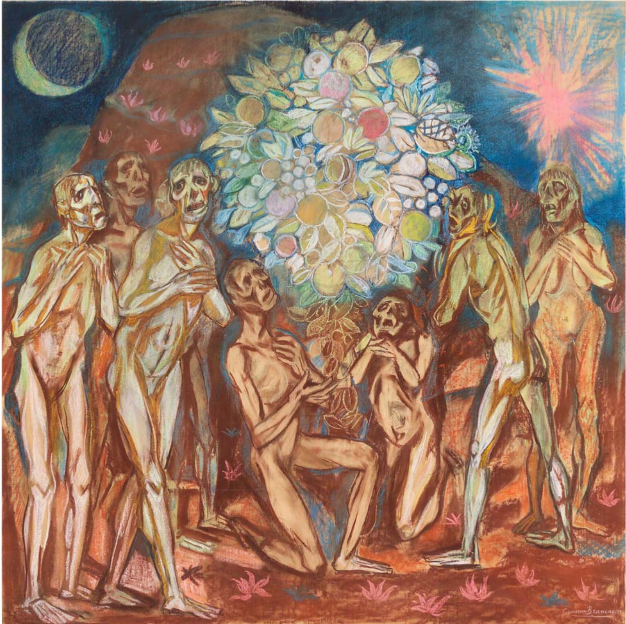
Giovanni Brancaccio, I golosi (tempera e pastello su carta, centimetri 155 per 157)