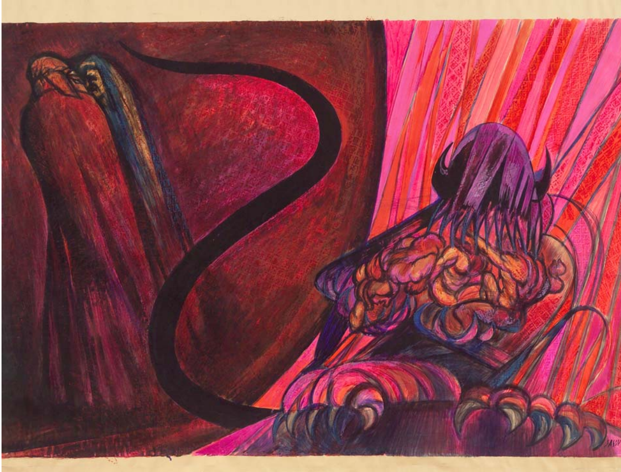
Aligi Sassu, Lucifero (tempera e pastello su carta, centimetri 114 per 150)