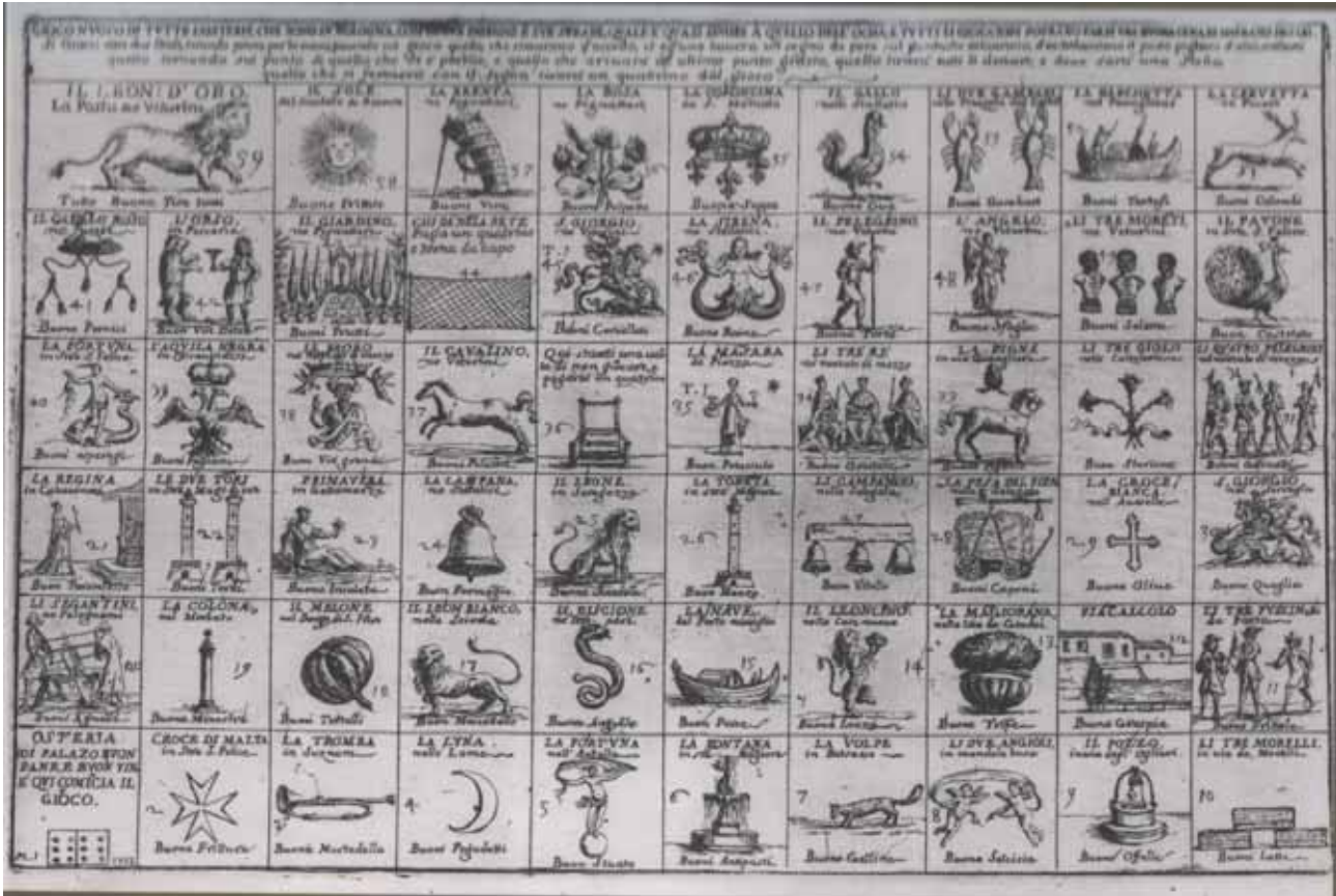
Il gioco nuovo di tutte le osterie di Bologna, Biblioteca dell'Archiginnasio, Bologna.