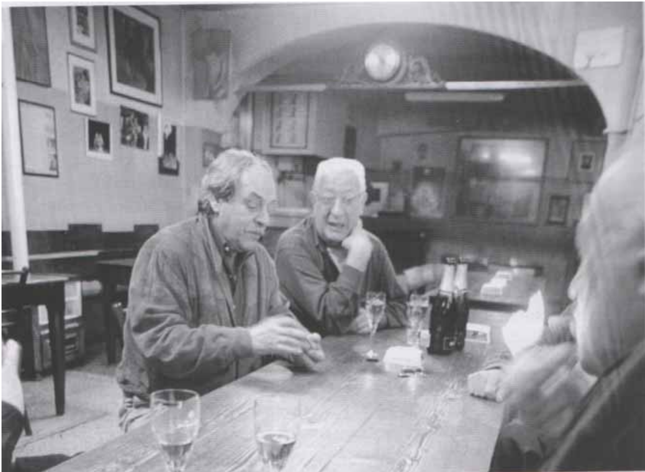
Una tipica serata fra habitués . (foto di Alfonso Santolero tratto da Bologna tra storia e osterie , a cura di Alessandro Molinari Pradelli – Pendragon)