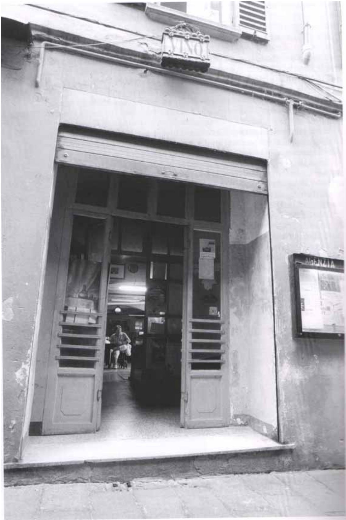
Ingresso dell'osteria del Sole. (foto di Alfonso Santolero tratto da Bologna tra storia e osterie , a cura di Alessandro Molinari Pradelli – Pendragon)