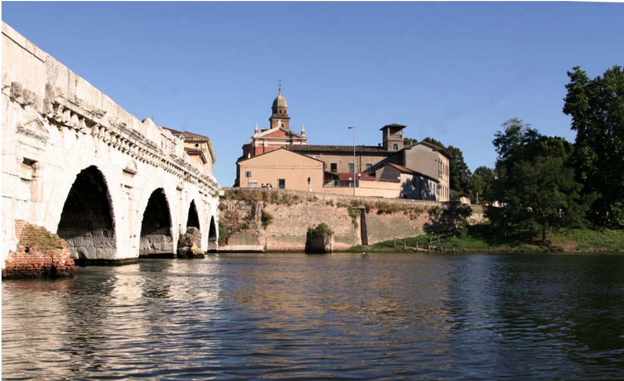
I bastioni di Rimini visti dal Ponte di Tiberio sul fiume Marecchia (21 dopo Cristo)