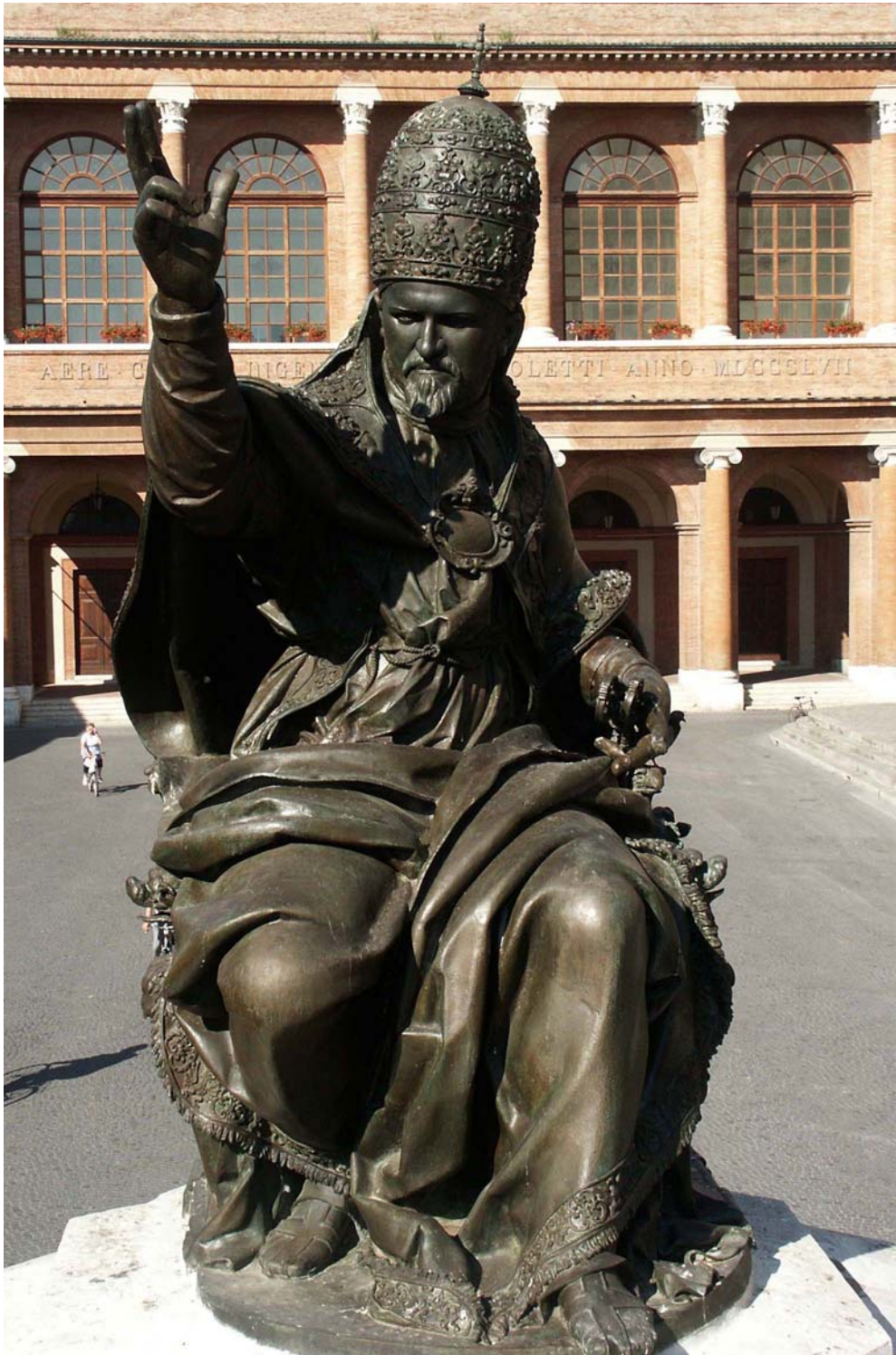
Piazza Cavour, nel centro storico di Rimini: la statua di Papa Paolo V (1614)