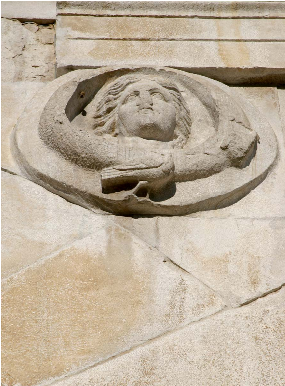
Un particolare dell'Arco di Augusto (27 avanti Cristo), nel centro storico di Rimini