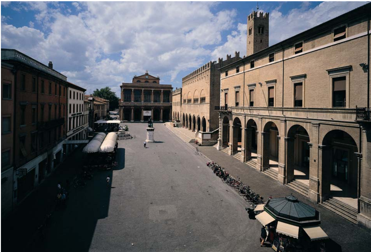
Piazza Cavour, nel centro storico di Rimini