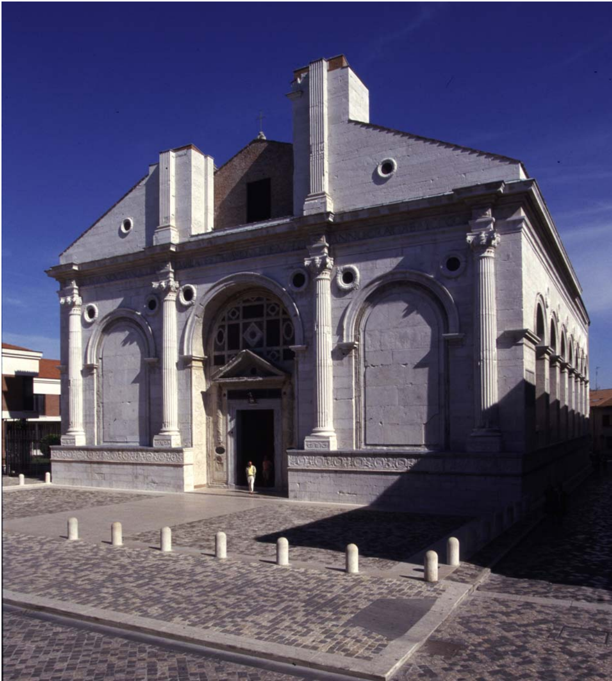
La facciata del quattrocentesco Tempio Malatestiano di Rimini