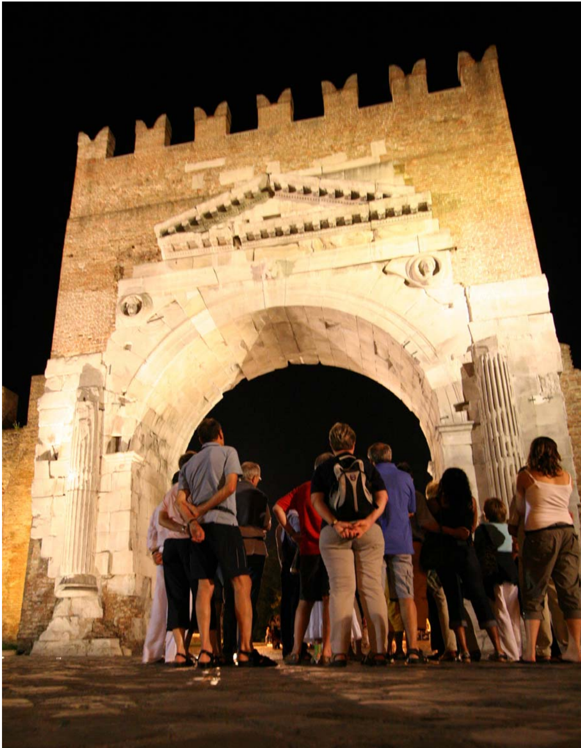
Rimini, "Festival del Mondo Antico": visita notturna all'Arco di Augusto (27 avanti Cristo)