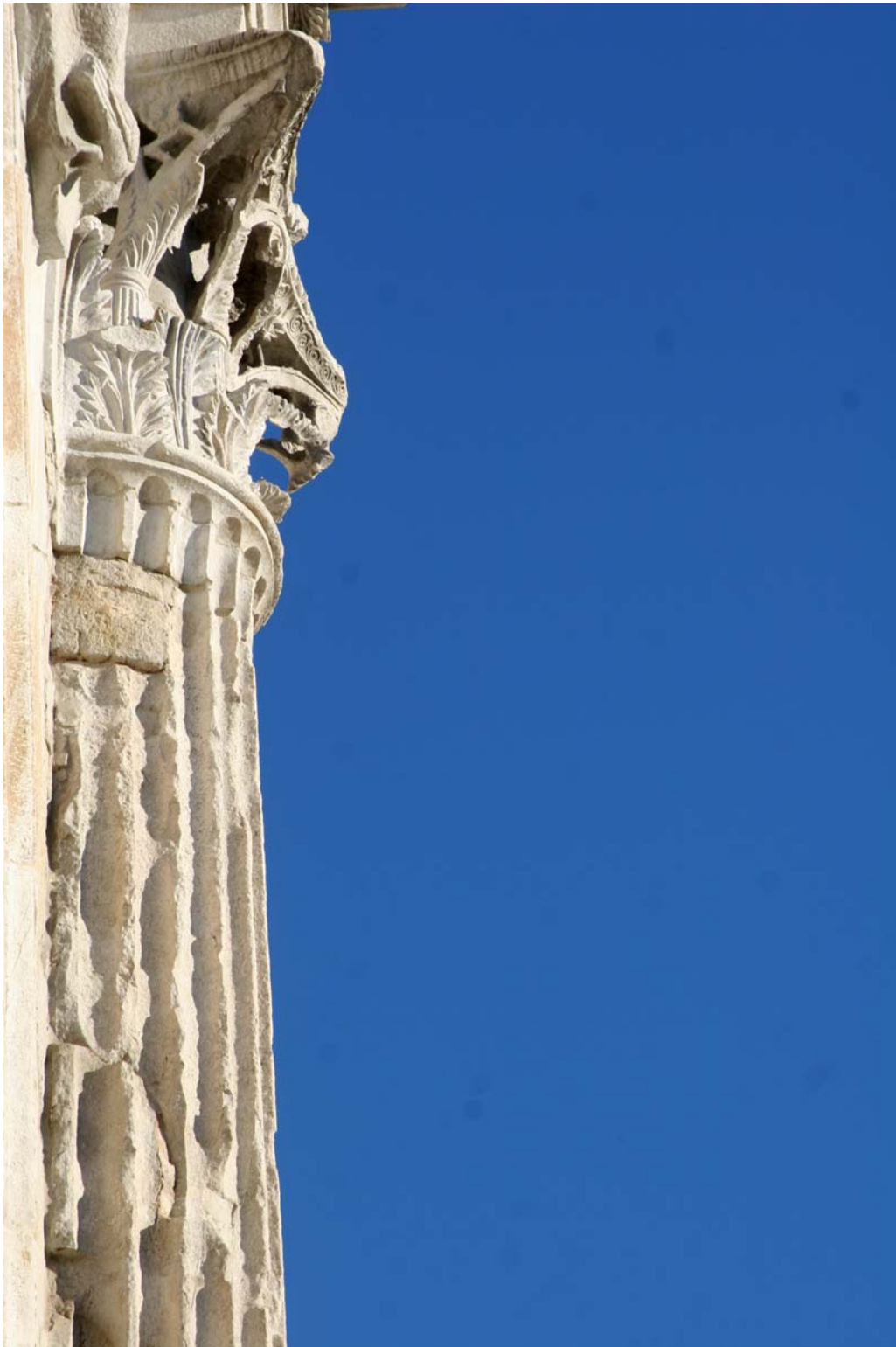
Un particolare dell'Arco di Augusto (27 avanti Cristo), nel centro storico di Rimini – fotografia di Emilio Salvatori