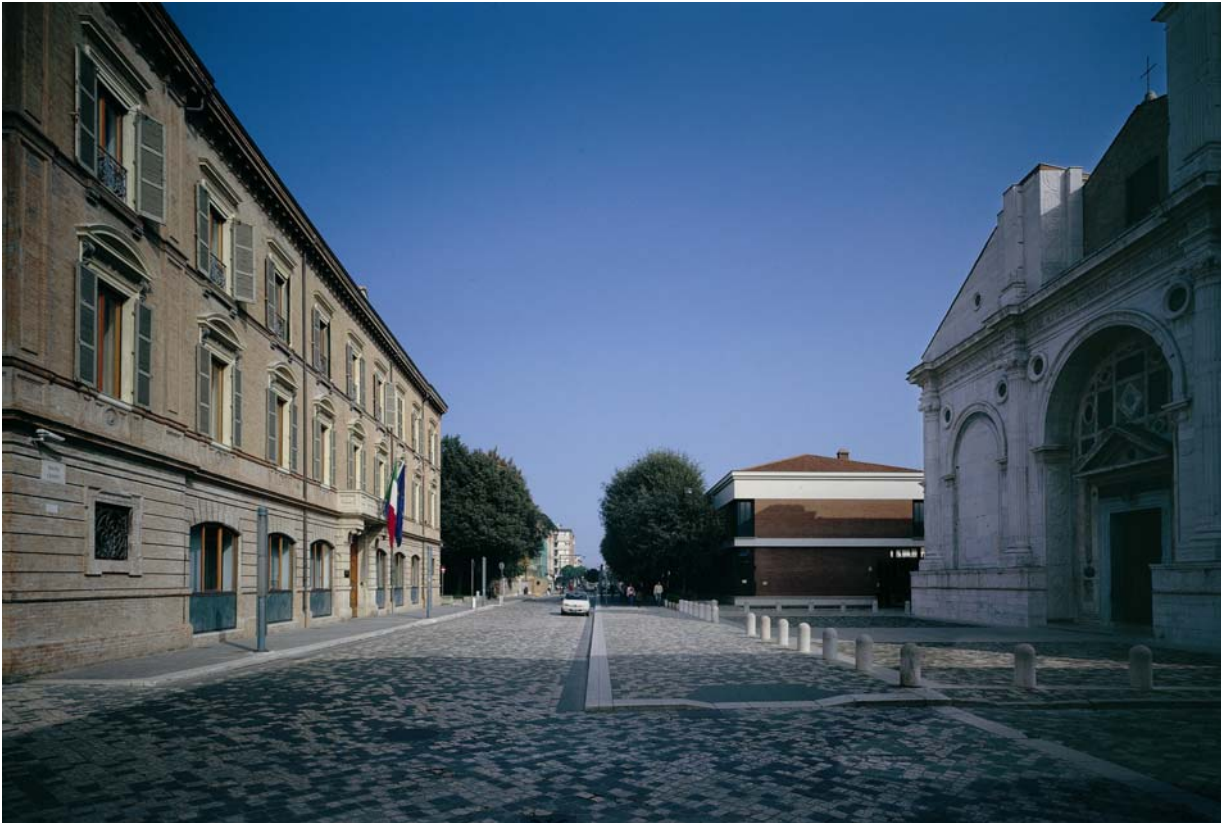
Rimini, via IV Novembre: a destra, il Tempio quattrocentesco di Sigismondo Pandolfo Malatesta