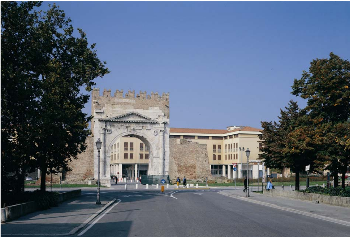
Rimini, via XX Settembre: l'ingresso al centro dall'Arco di Augusto (27 avanti Cristo)