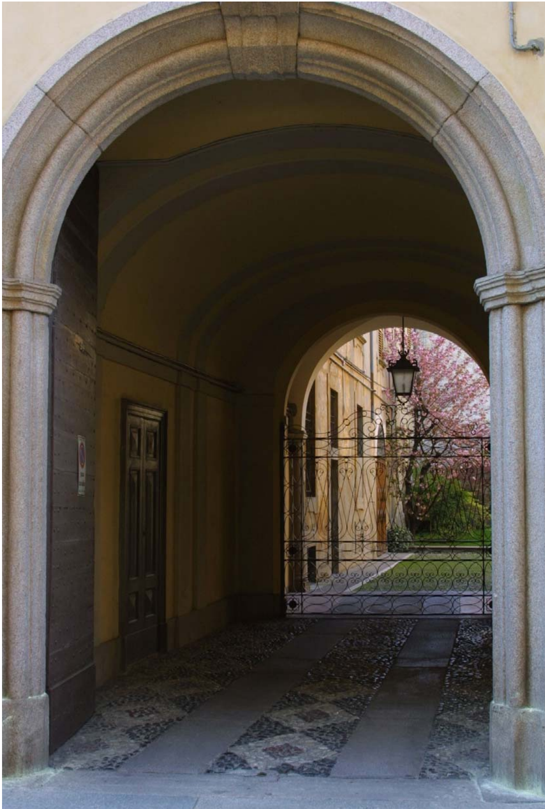
Piacenza: l'entrata di un palazzo storico in corso Garibaldi