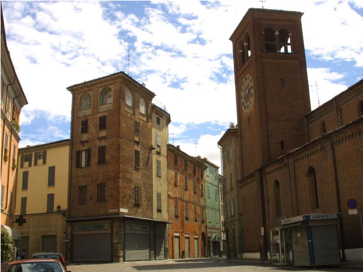
Piacenza, piazza Borgo: limite a ovest della vecchia città romana, da qui si diramano via del Castello, via Campagna e via Taverna, tre delle strade storiche della città