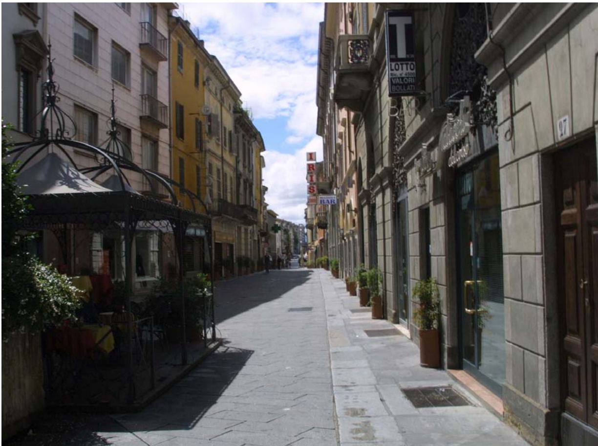
Piacenza, corso Vittorio Emanuele, detto anticamente "San Raimond" e, più recentemente, "al Curs"