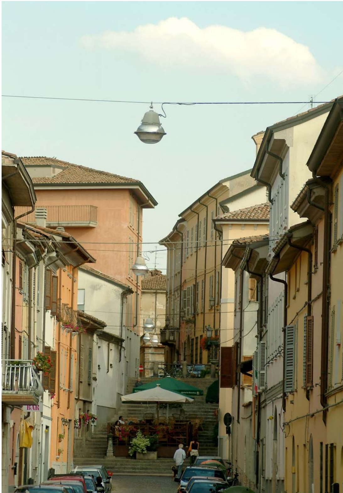
Piacenza, la "muntà di rat": scalinata che collega via Mazzini alla più bassa via San Bartolomeo