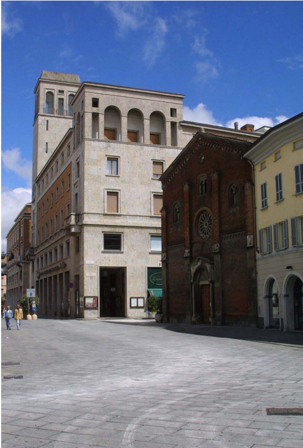
Piacenza, largo Battisti: la chiesa medievale di San Donnino – fotografia di Davide Rossi