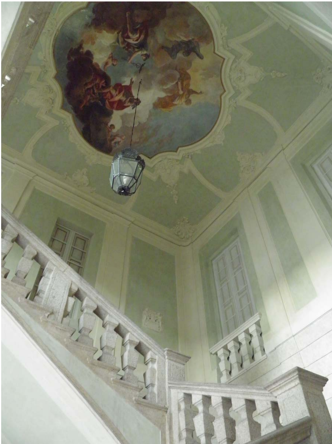
Piacenza, tra via Pietro Giordani e piazza Sant'Antonino: lo scalone di sinistra del settecentesco Palazzo Anguissola Cimafava Rocca