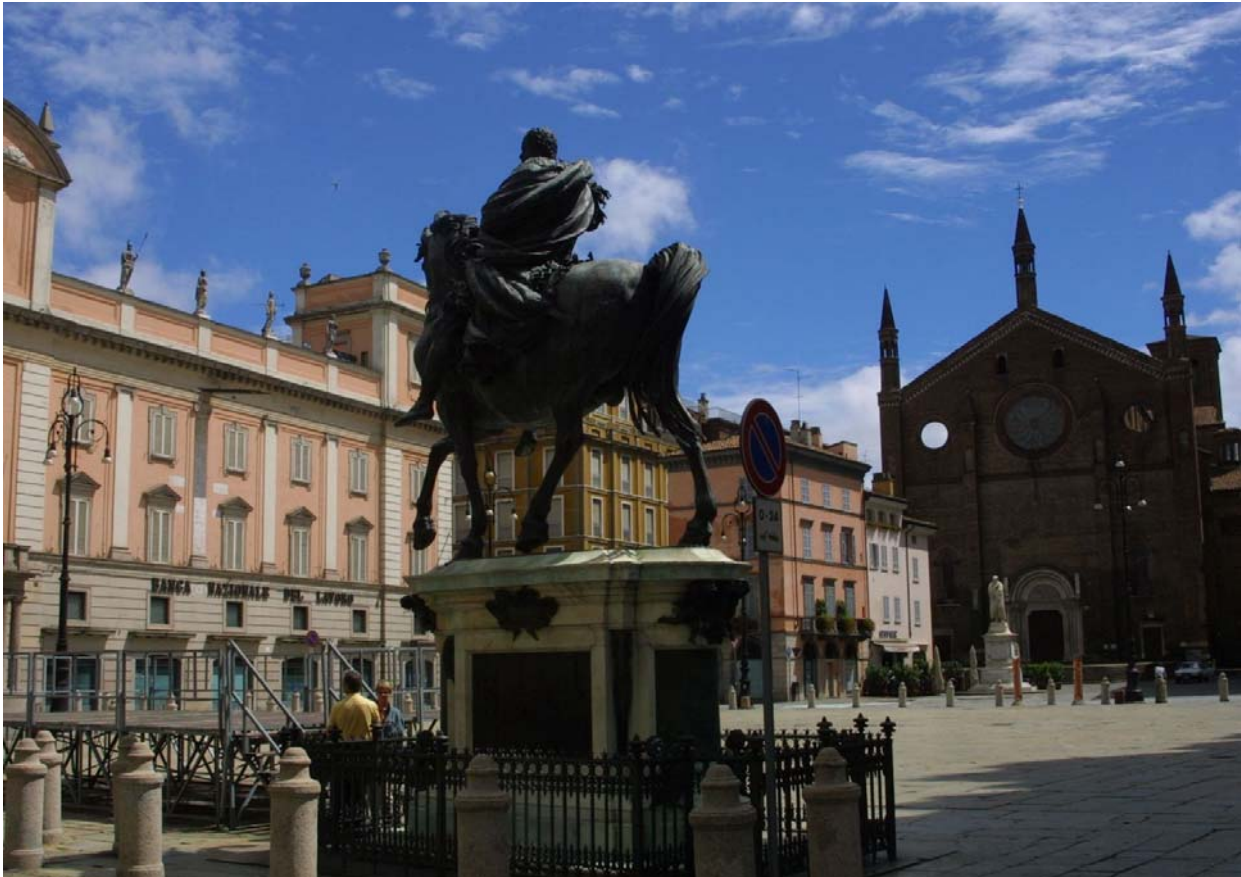
Piacenza, piazza dei Cavalli: la statua equestre di Ranuccio Farnese, opera di Francesco Mochi da Montevarchi (1620) e sullo sfondo la chiesa medievale di San Francesco