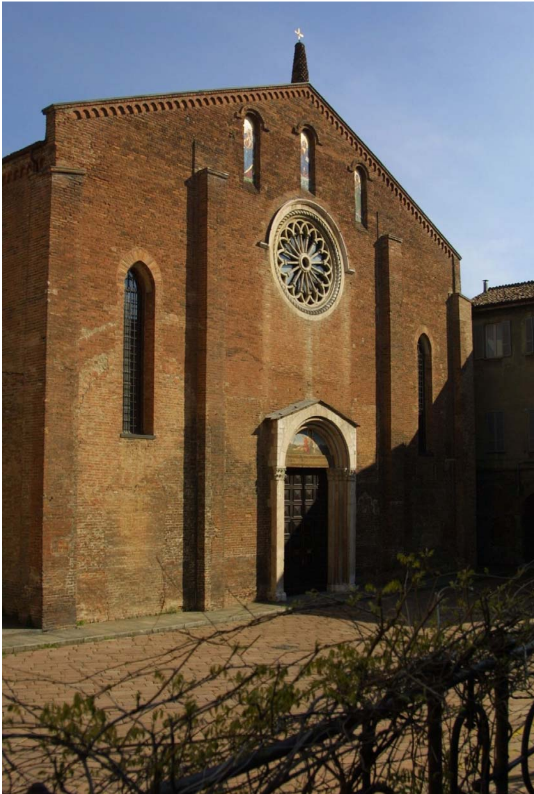
Piacenza, via Beverora: la basilica duecentesca di San Giovanni in Canale