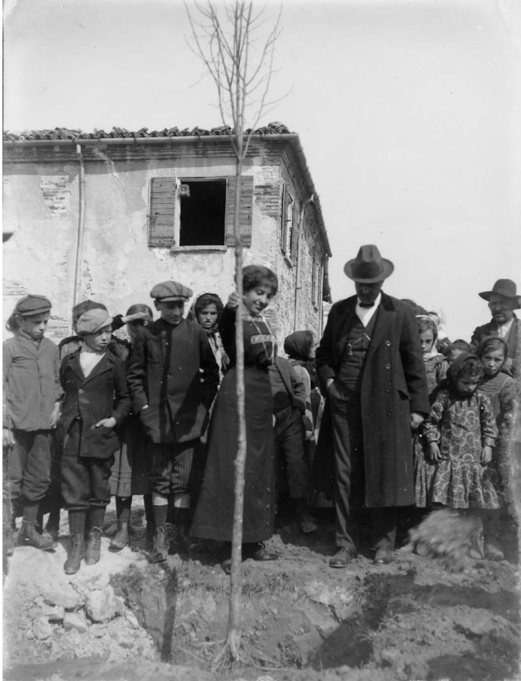
Roversano (Cesena), 17 marzo 1912: un momento della “Festa degli alberi”