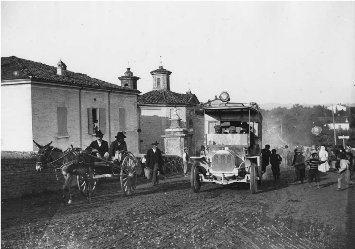
Il passaggio della prima autocorriera sul Ponte Vecchio di Cesena, intorno al 1909: sulla sinistra la chiesetta della Brenzaglia, poi distrutta durante la Seconda guerra mondiale