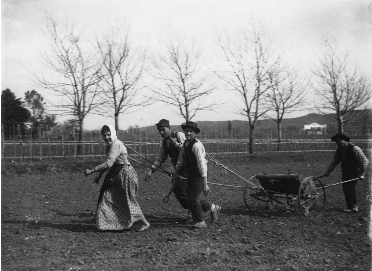
La semina a San Vittore di Cesena, intorno al 1910