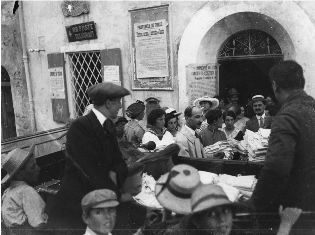
Raccolta di bende e teli destinati alla Croce rossa italiana di Cesena, durante la Prima guerra mondiale, tra 1915 e 1918 –