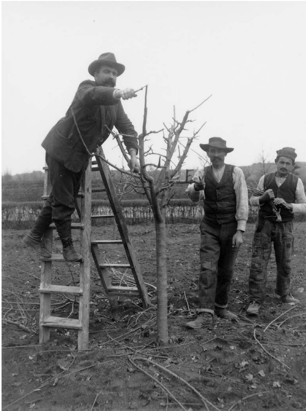
La potatura a San Vittore di Cesena, intorno al 1910