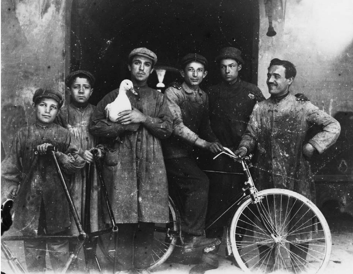
Operai di un'officina elettro galvanica nel cortile del palazzo Lelli-Mami a Cesena, intorno al 1911