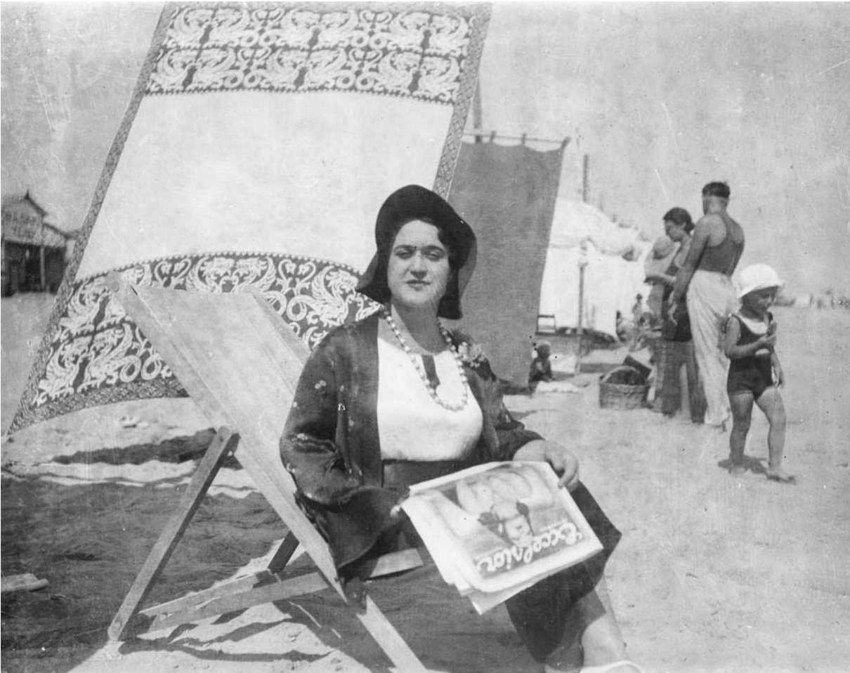
Ritratto di signora sulla spiaggia, intorno al 1931