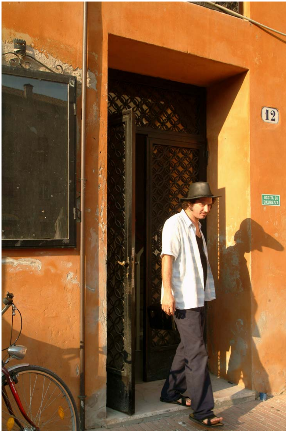
Ferrara, 2004: Vinicio Capossela esce dalla Sala Estense prima del suo concerto a "Ferrara Sotto le Stelle"