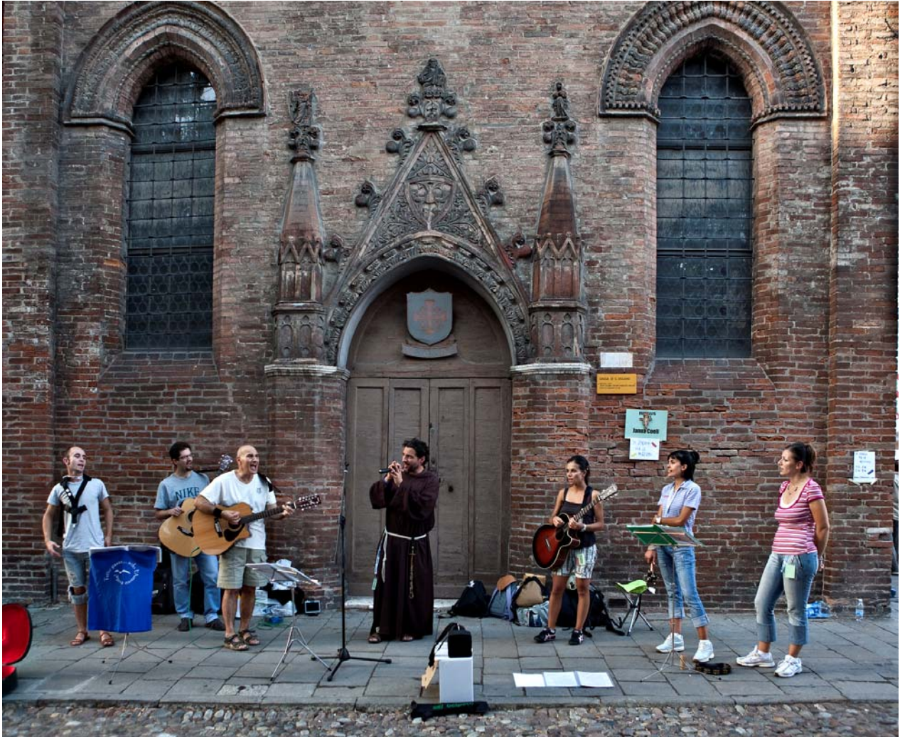
Ferrara, 2007: il "Buskers festival"