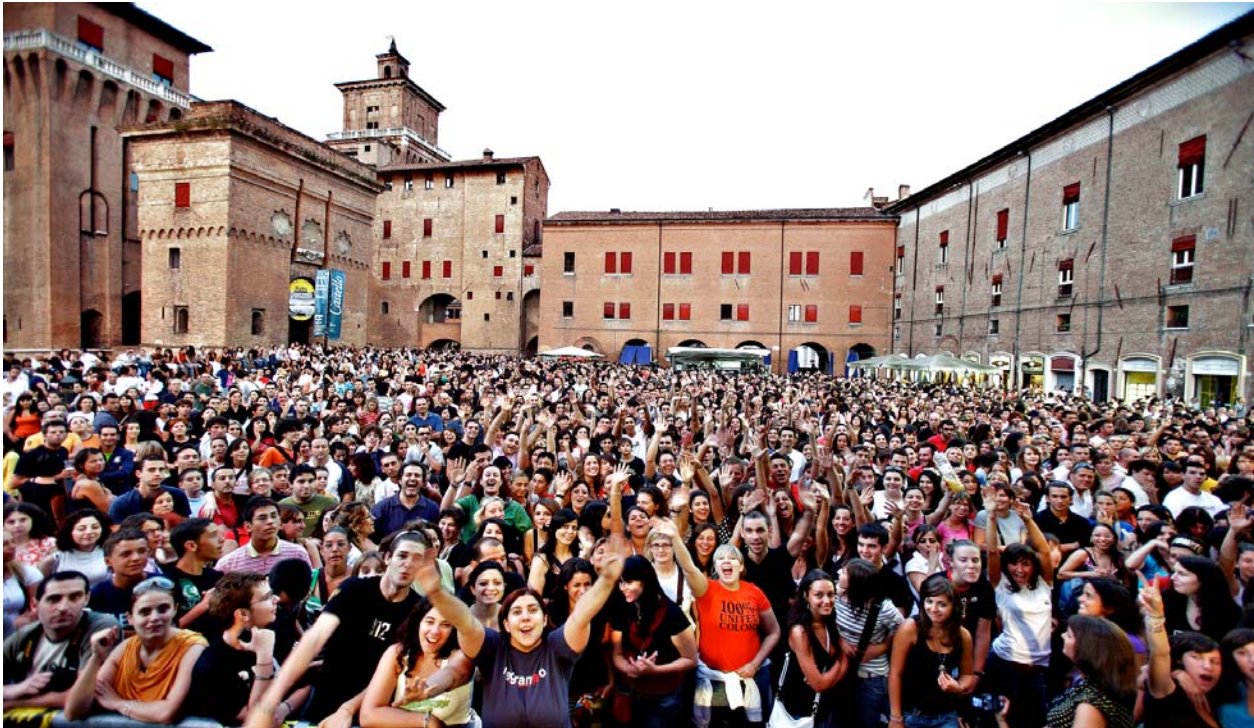
Ferrara, 2007: il pubblico di "Ferrara Sotto le Stelle" attende il concerto dei Negramaro