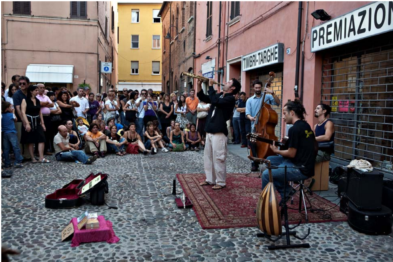
Ferrara, 2002: il "Buskers festival"