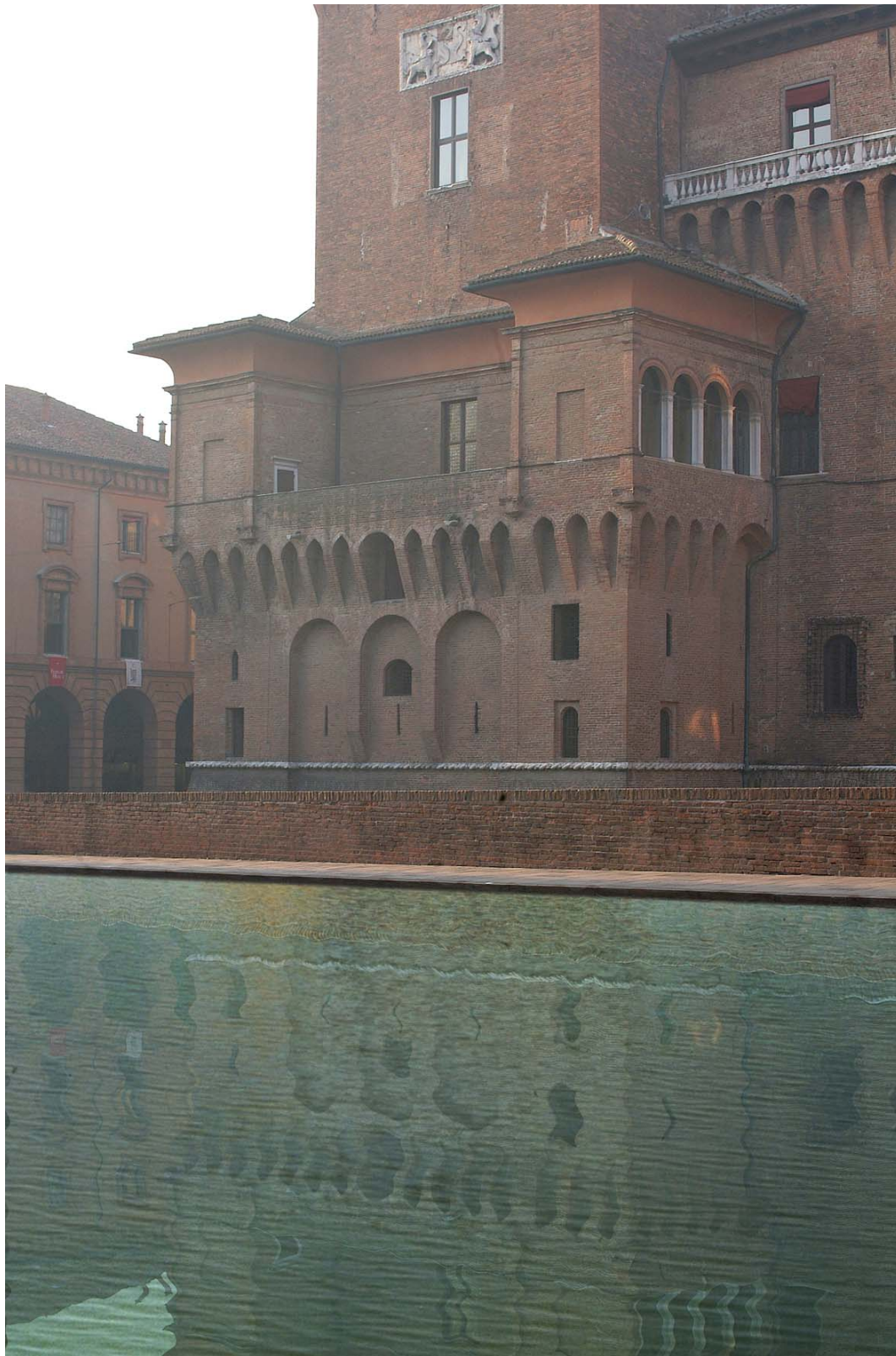
Se il fiume riprendesse il controllo su Ferrara: il Castello Estense visto da corso Martiri della Libertà... – fotomontaggio di Luca Gavagna