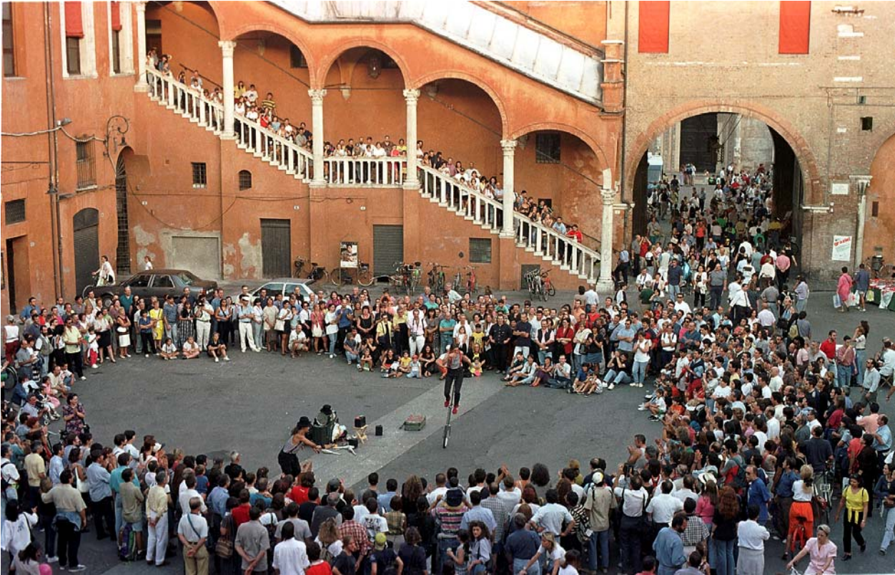
Ferrara, 2007: il "Buskers festival"