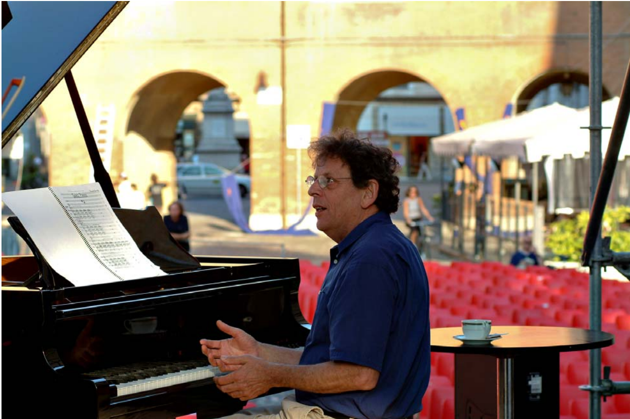
Ferrara, 2004: Philip Glass in piazza Castello prima del concerto di "Ferrara Sotto le Stelle"