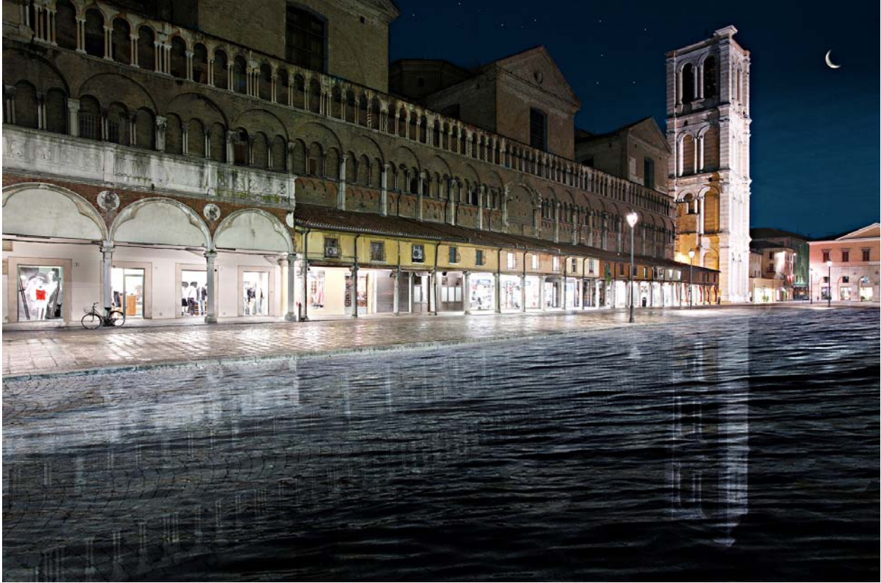
Ferrara, piazza Trento e Trieste: il Po è esondato, ma la vita continua... – fotomontaggio di Luca Gavagna