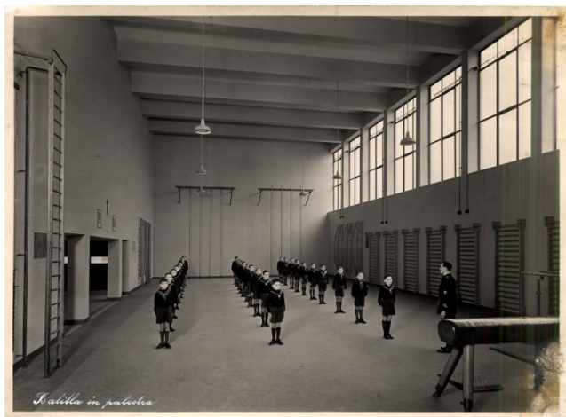
Giovani Balilla in una palestra. Italia, s.d.