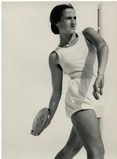
Lanciatrice di disco, foto di Liselotte Grschebina, 1937.