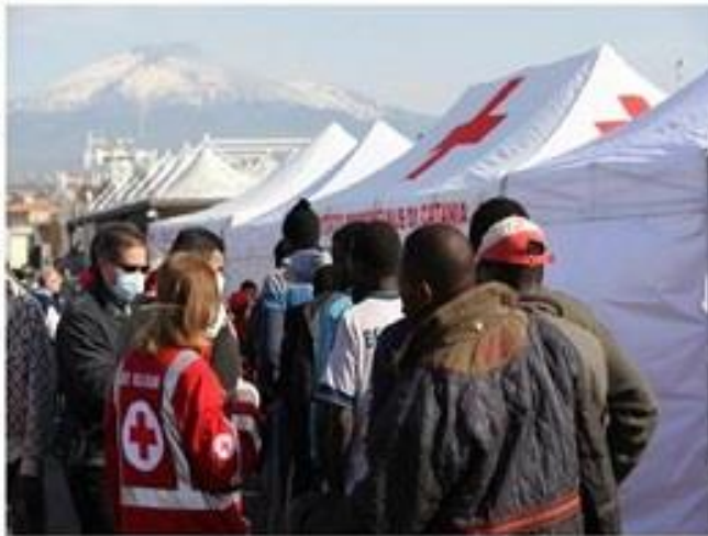
Italian Red Cross staff receiving migrants in Southern Italy.

8 May 2015: Emergency Appeal launched for CHF 2.8 million.