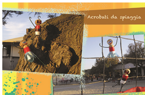
minime differenze nel design tra la prima e la seconda cartolina, espresse con splash di colore

Quanti set di cartoline preparare? Il numero è sia diretta conseguenza del numero di classi che si desidera coinvolgere; e sia prevedendo che una certa quantità resta a Concittadini e all’Ass. Lucertola Ludens APS (d cui si prevede la distribuzione durante i pubblici eventi di animazione cittadina che anticipano e durante la Festa del diritto al gioco).