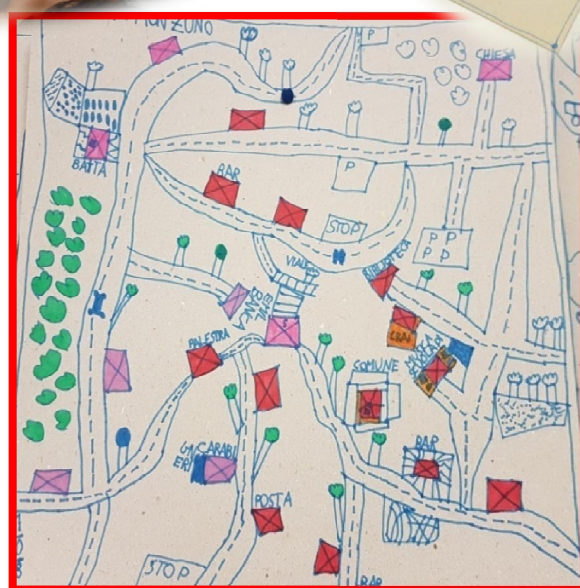
Mappe della classe seconda