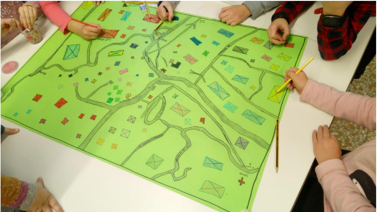
Mappe della classe quinta

Questo è stato un punto importante da cui partire per allargare gli orizzonti ad altri luoghi da scoprire del nostro territorio e per la costruzione di nuove mappe.