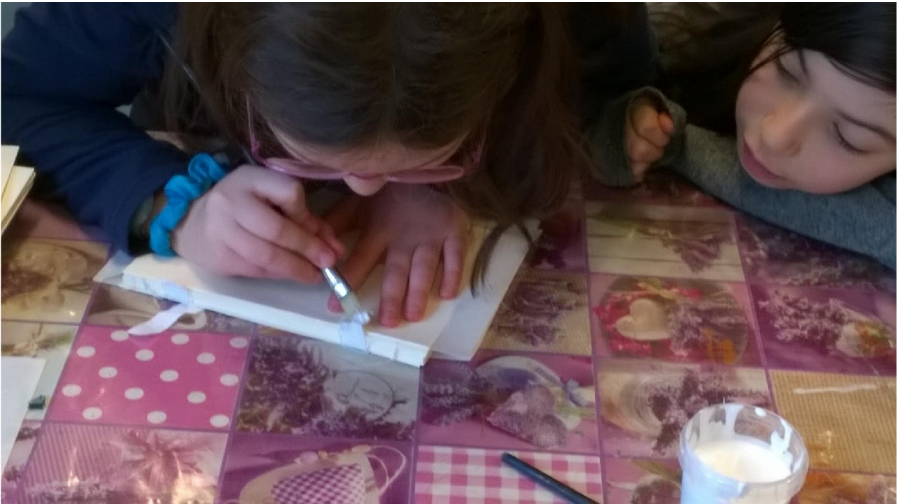
FASE 5: INDORSATURA

FASE 5 - INDORSATURA: utilizzando colla vinilica, si attaccano le sguardie, ovvero fogli di carta più spessi, piegati a metà, che vengono incollati sopra e sotto il quaderno; serviranno per fissare la copertina; si spalma la colla sul dorso del quaderno; si incollano i pezzettini di fettuccia sulle sguardie e la garza sul dorso.