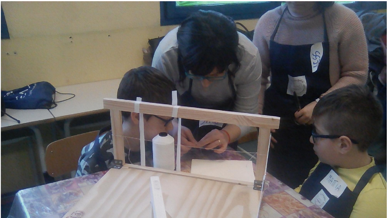
FASE 3: PREPARAZIONE DEI TELAI

FASE 4 - CUCITURA: si comincia sempre dal lato destro, infilando l'ago nel primo foro; si tira il filo, facendo molta attenzione, sempre verso il senso della cucitura; quando si è finito di cucire il primo quinterno, si torna indietro cucendo il secondo; si fa un nodino per unire i due quinterni; durante la cucitura dei quinterni successivi, si deve sempre terminare con una catenella, passando l'ago sotto il fascicolo precedente.