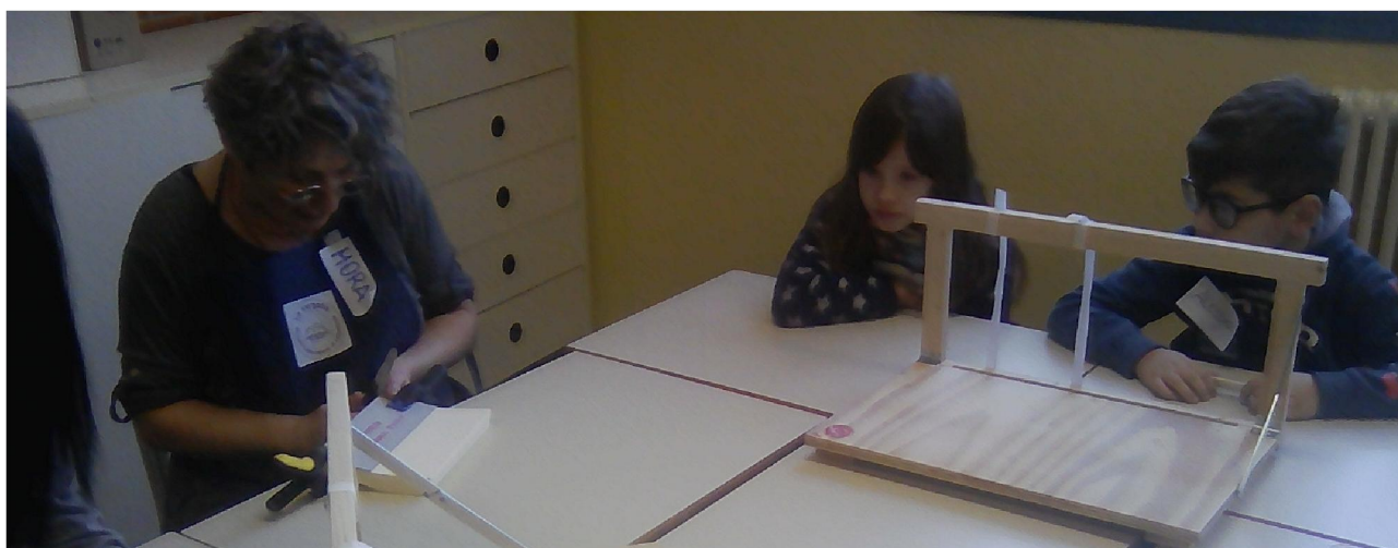
FASE 2: GRECAGGIO

FASE 2 - GRECAGGIO: i quinterni vengono fermati con due morsetti; successivamente, con un seghetto, vengono fatte su di essi delle incisioni a distanze ben precise; le incisioni vengono poi marcate