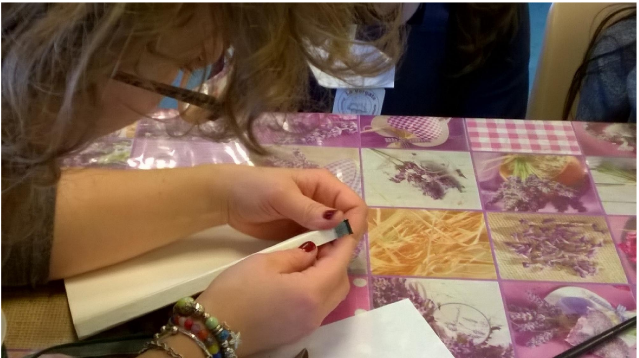
FASE 7: INCOLLATURA DEL CAPITELLO