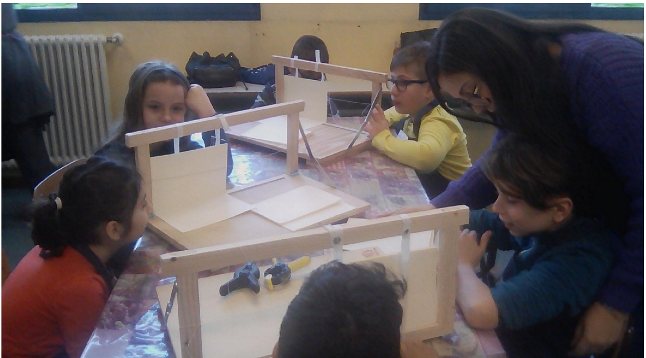
FASE 4: CUCITURA

FASE 4 - CUCITURA: si comincia sempre dal lato destro, infilando l'ago nel primo foro; si tira il filo, facendo molta attenzione, sempre verso il senso della cucitura; quando si è finito di cucire il primo quinterno, si torna indietro cucendo il secondo; si fa un nodino per unire i due quinterni; durante la cucitura dei quinterni successivi, si deve sempre terminare con una catenella, passando l'ago sotto il fascicolo precedente.