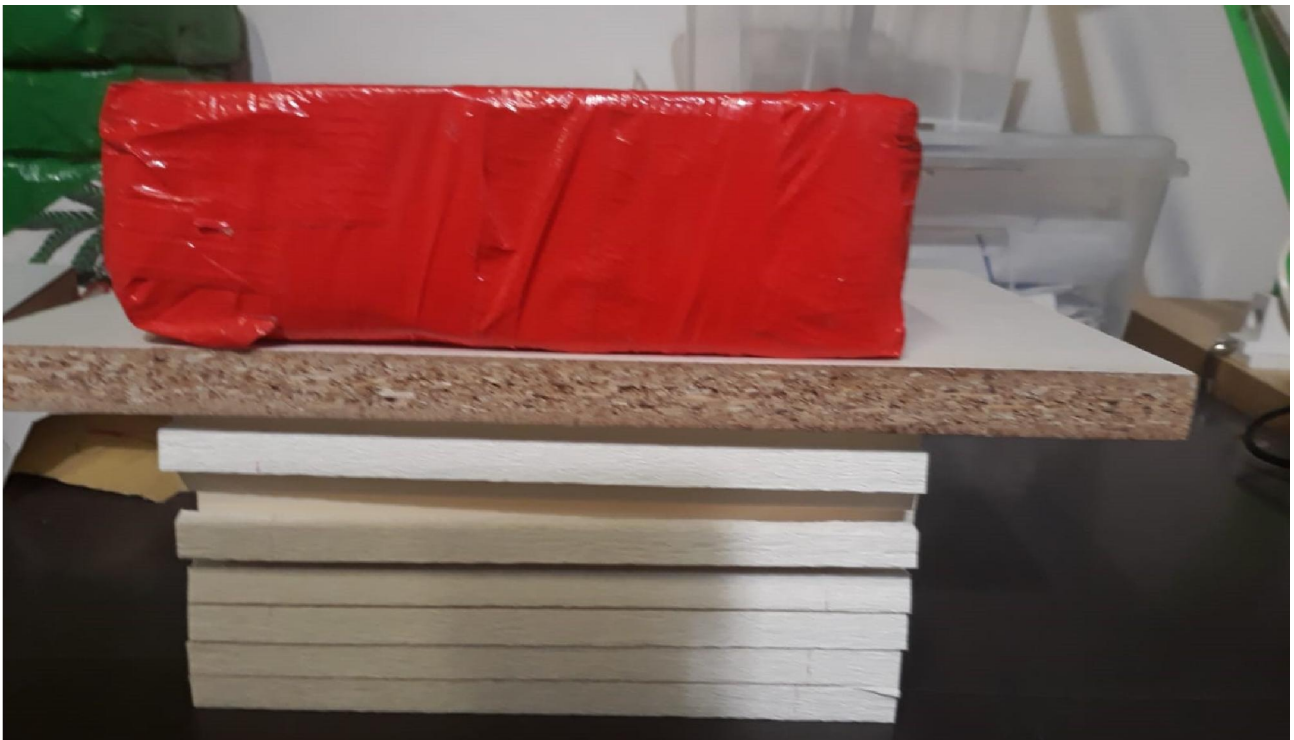
FASE 6: SI METTE TUTTO SOTTO PESO