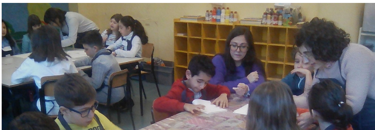
FASE 1: PREPARAZIONE DEI QUINTERNI

FASE 1 - PREPARAZIONE DEI QUINTERNI: i fogli, formato A4, vengono piegati a metà e inseriti uno dentro l'altro in fascicoli da 5 ognuno.