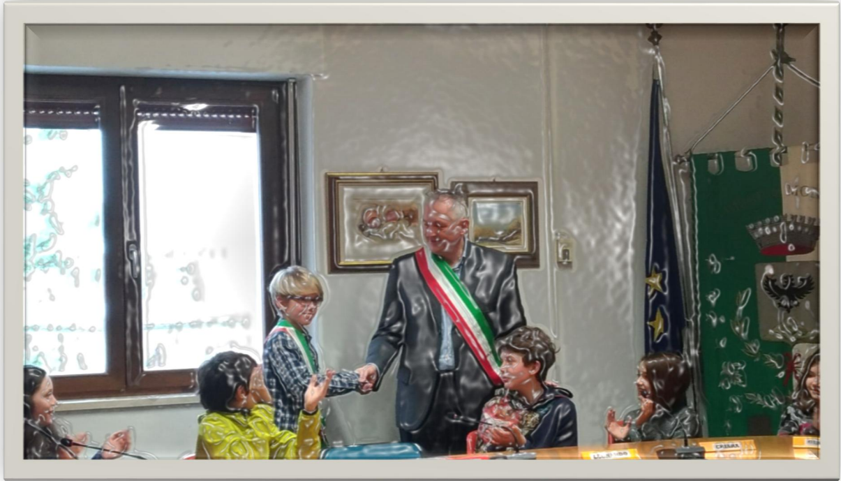
I due "Sindaci" si scambiano una stretta di mano