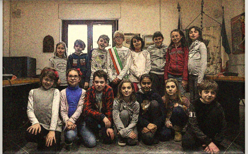
La classe quarta con il Sindaco del CCR