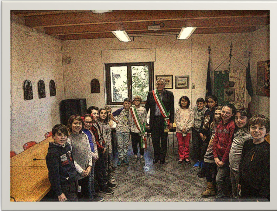
La classe quarta con il Sindaco di Monzuno