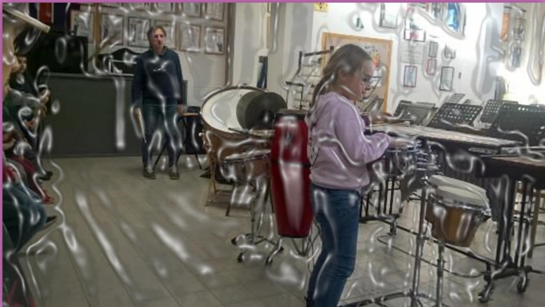
Un po' di percussioni non fanno mai male...