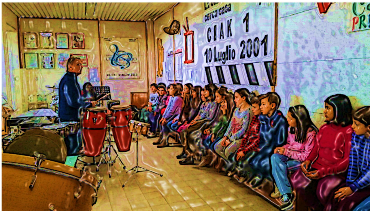
Le classi VA e VB nell’Aula Luigi Gamberini