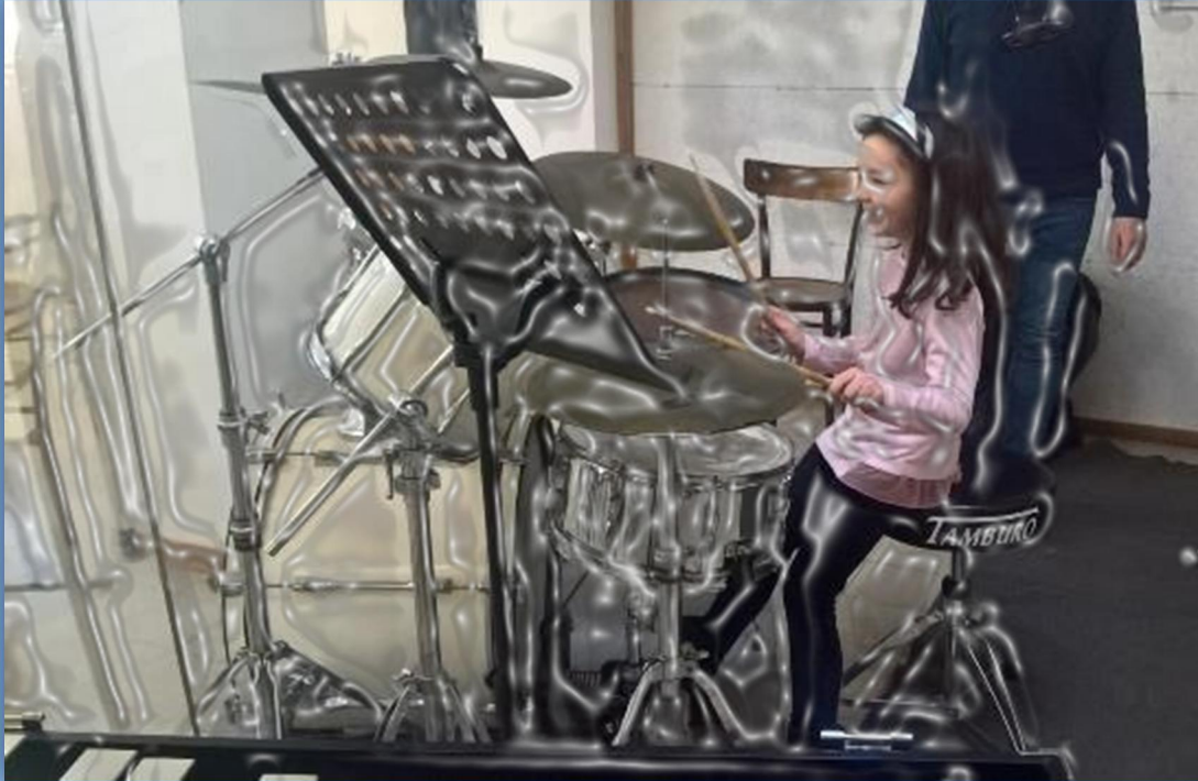
Finalmente alla batteria