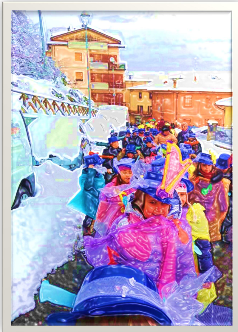
I bambini sfilano nel paese ricoperto di neve

L'esperienza è stata talmente entusiasmante che gli strumenti musicali sono stati il tema scelto per l'annuale sfilata di carnevale; infatti ogni anno la Scuola Primaria di Monzuno sfila per il centro del paese, ogni classe sceglie un tema ed i costumi vengono preparati a scuola assieme ai bambini.