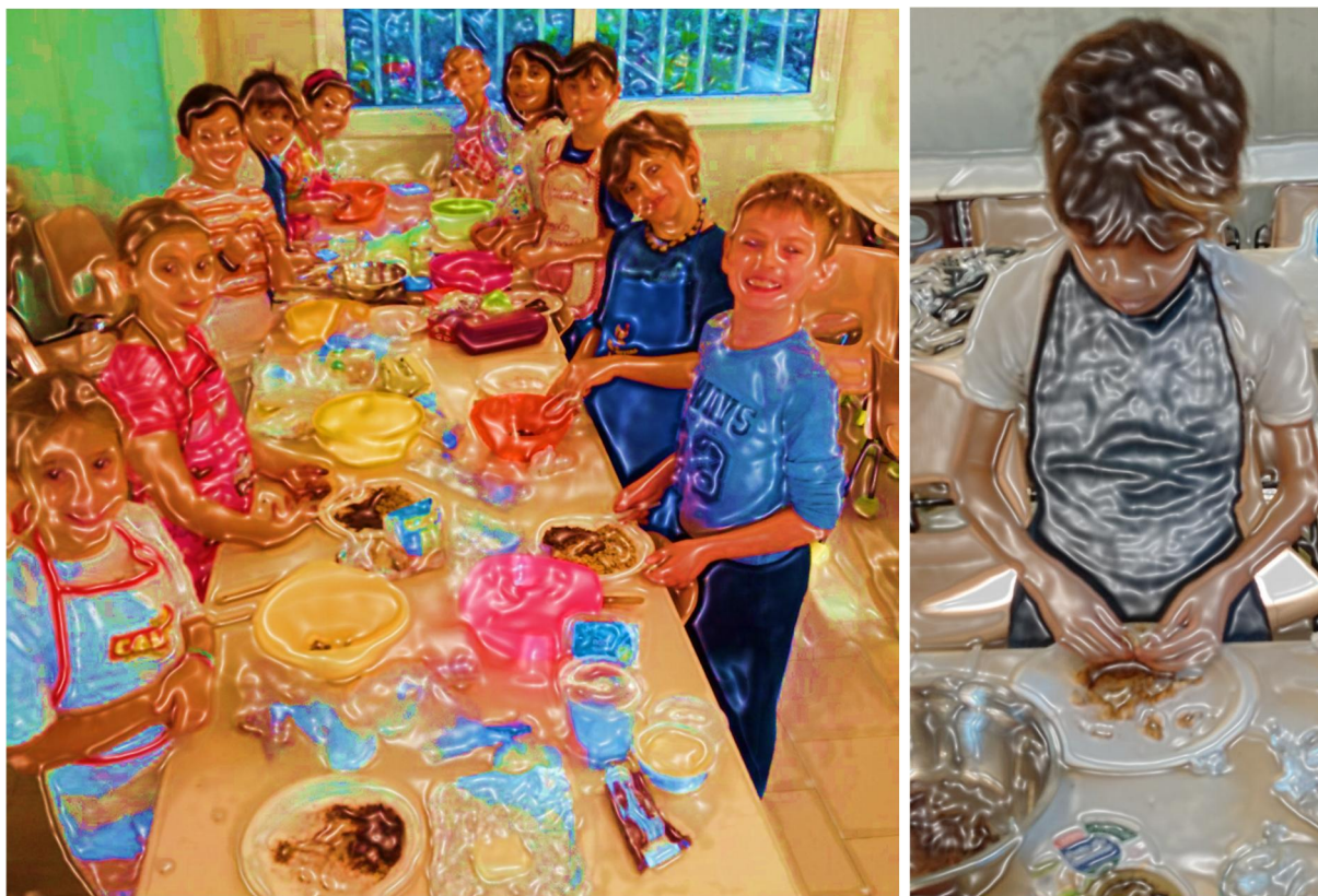
I ragazzi della quinta preparano la torta di noci

Il 18 ottobre, le classi quarte hanno invece preparato una torta tipica della zona utilizzando un frutto di stagione, la “torta di noci”.