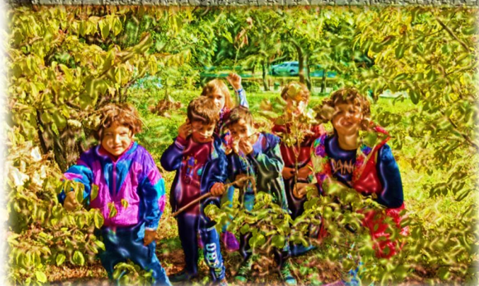
Alla baita degli alpini ed in mezzo alla natura