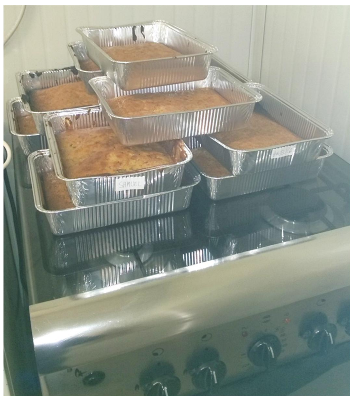
Le torte sono pronte