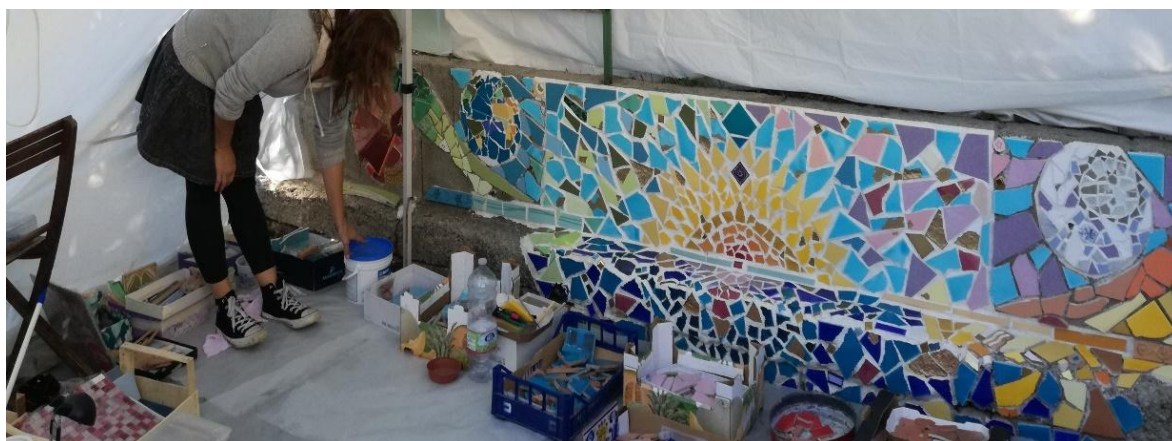
Opere d'arte con l'utilizzo di mattonelle dipinte

Le classi sono state accolte da alcuni artisti che le hanno accompagnate nella visita mostrando ciascuno la propria forma d'arte.