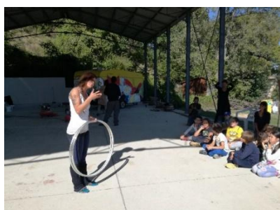
Anche i cerchi sono una forma d'arte

A scuola i ragazzi hanno realizzato una presentazione per ricordare quanto avevano visto in quella giornata così particolare.