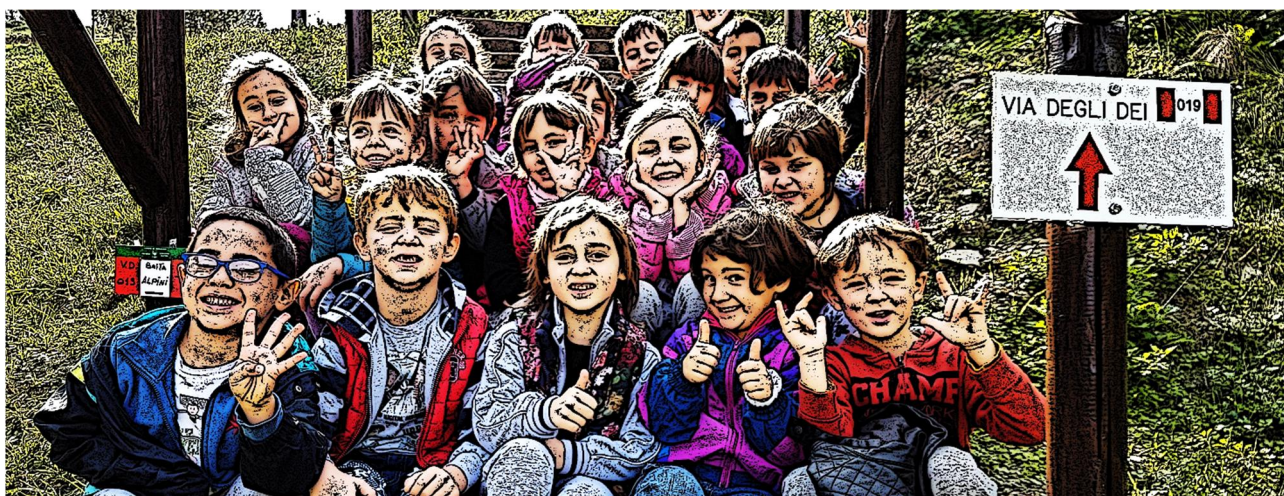
La Via degli Dei e la classe prima

Molti amanti del trekking e della mountain bike attraversano la Via degli Dei per assaporare la storia e la bellezza di questi luoghi. In alcuni punti i sentieri passano sulle antiche pavimentazioni, che hanno resistito per oltre 2000 anni!