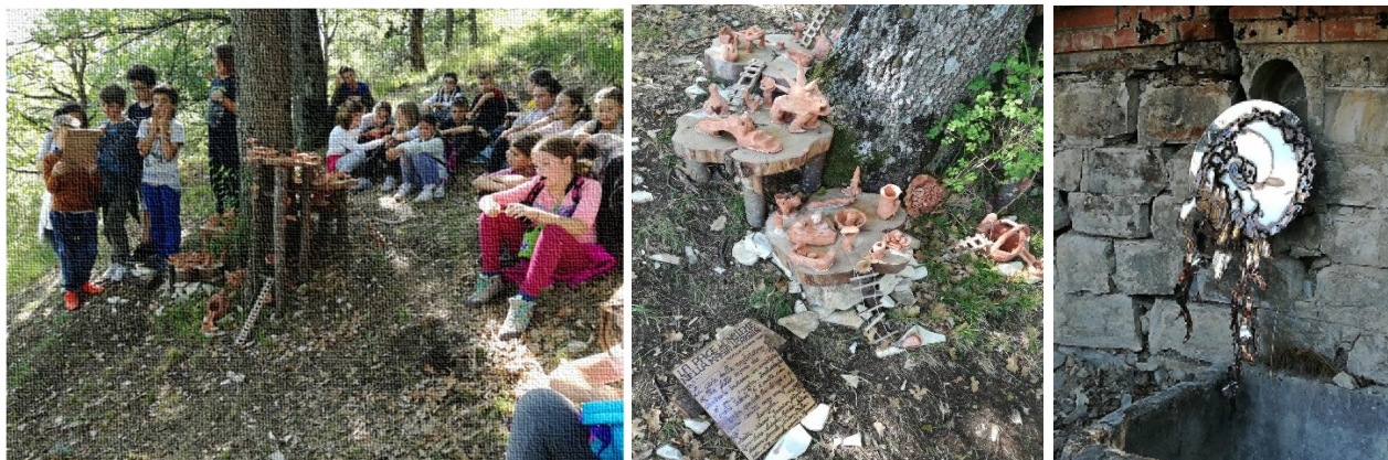
I ragazzi delle classi quinte osservano la loro installazione ed alcune opere

Il 22 settembre , i ragazzi delle classi quinta A e quinta B , si sono incamminati per i sentieri di Monzuno per raggiungere il museo all'aperto "Tracce d'Arte" situato nella vicina località Campagne. Il museo è parte integrante del bosco e raccoglie tutte le opere create dagli artisti che desiderano lasciare un segno in questi luoghi. Una piccola installazione è stata creata l'anno scorso dai ragazzi stessi.