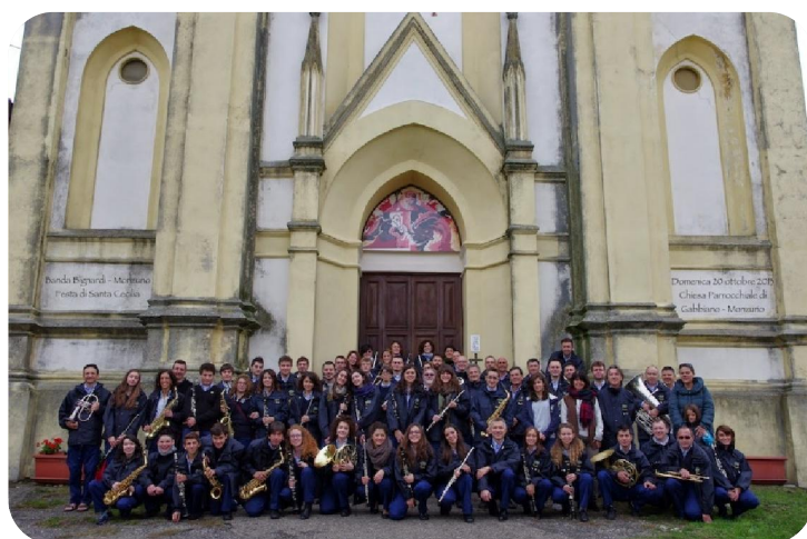
Componenti della Banda Bignardi