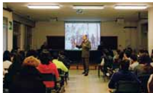
Un momento della "lezione" agli studenti della Dante

Interminabili e violente piogge, campagne ed abitazioni allegate a Modena in questi giorni? Ed ecco i pontieri di Piacenza sollevare di peso anziani dei luoghi, caricarsi sulle spalle e re-