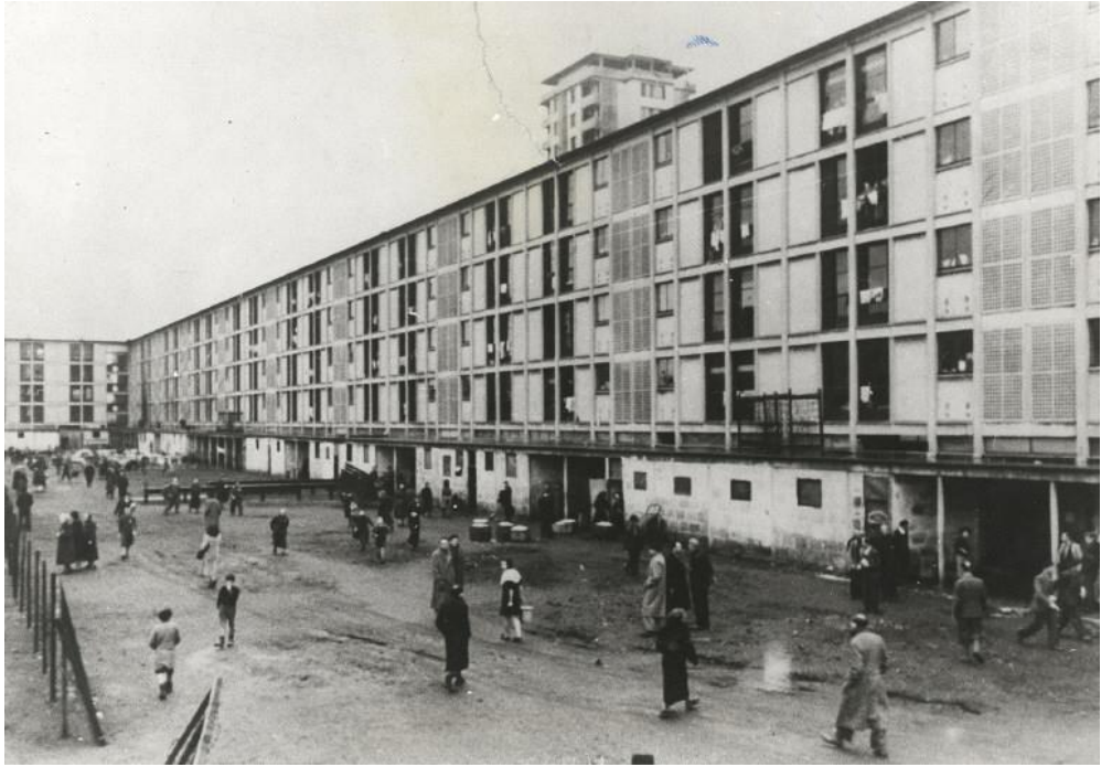
3: Detenuti ebrei nel cortile del campo di Drancy, dicembre 1942