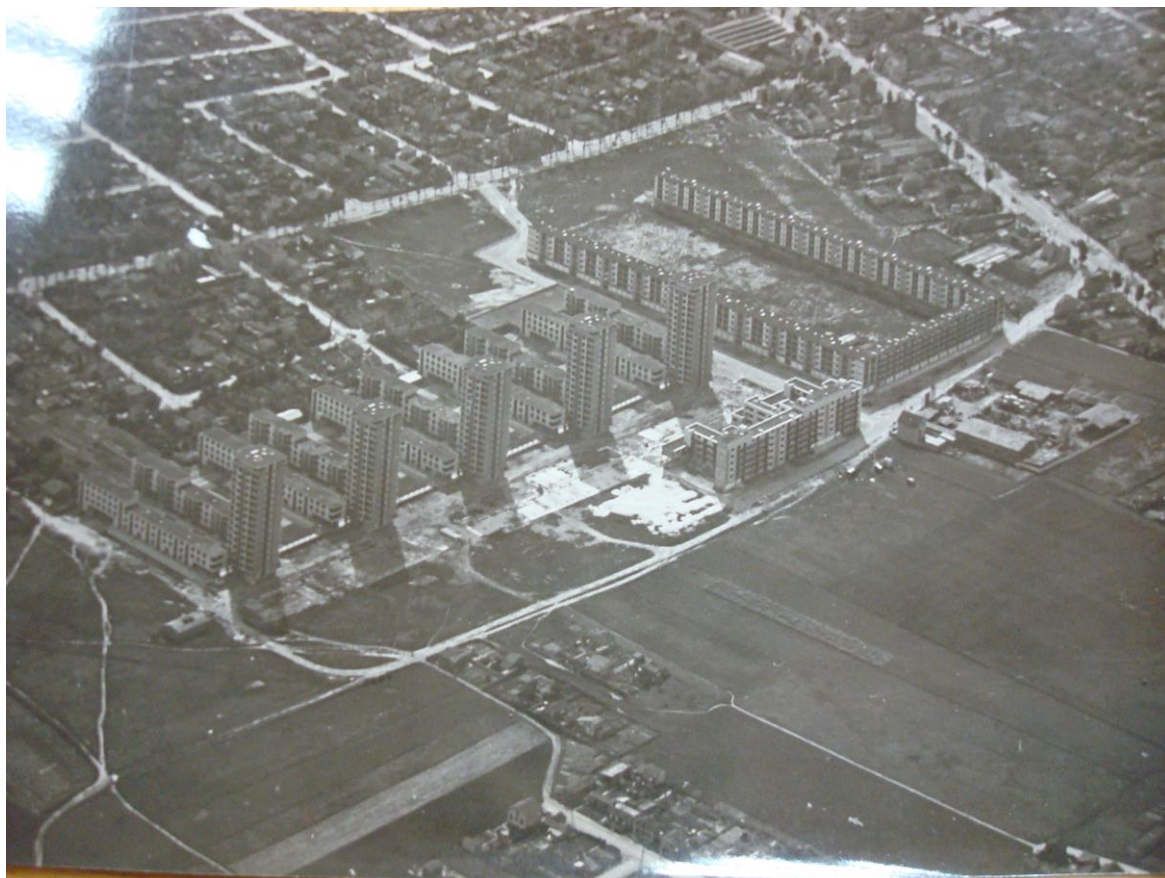
1: Veduta aerea della Cité de la Muette à Drancy, anni Trenta, CDJC

Dal settembre 1944 Drancy diventa per alcuni mesi un campo di detenzione per collaborazionisti in attesa di giudizio, ma subito dopo la Cité della Muette viene destinata al suo originario uso abitativo. Già dal 1945 sono state organizzate molte cerimonie commemorative, bisognerà tuttavia aspettare il 1976 perché un monumento, opera dello scultore Shlomo Selinger, sopravvissuto alla Shoah, sia eretto all'interno del cortile. Luogo emblematico della collaborazione del regime di Vichy alla "Soluzione finale", Drancy occupa oggi un ruolo fondamentale nella memoria della Shoah in Francia.