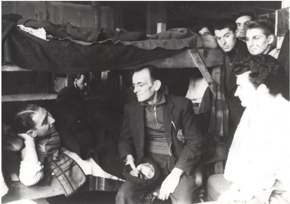
4: Detenuti ebrei in un dormitorio a Drancy, dicembre 1942, CDJC