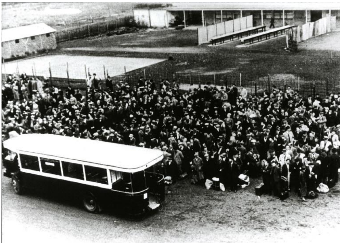
2: L'arrivo dei primi detenuti ebrei a Drancy, agosto 1941, CDJC