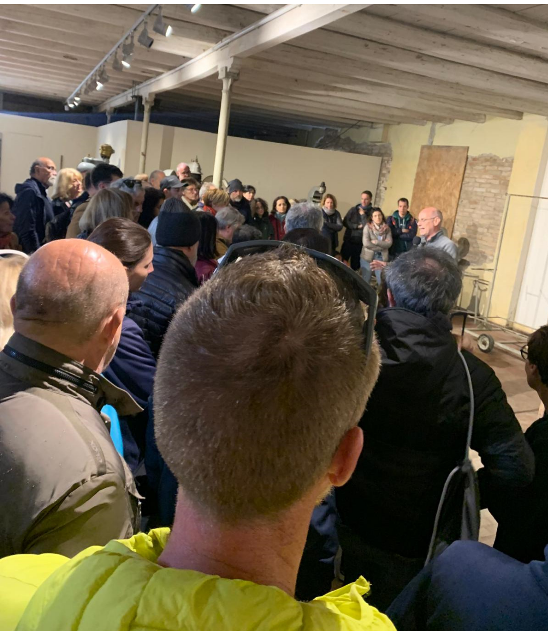
Passeggiata itinerante nell'eco-museo in allestimento della Manifattura dei Marinati di Comacchio